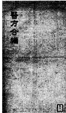
그림 1. 표지

이 책은 자서(自序)와 발문(跋文)이 없기 때문에 저자에 관한 정보는 전무하다. 단, 그 성립 시기에 대해서는 책의 구성과 내용을 통해 대략적인 추정이 가능하다. 자세한 내용은 아래 장에서 다루기로 한다.