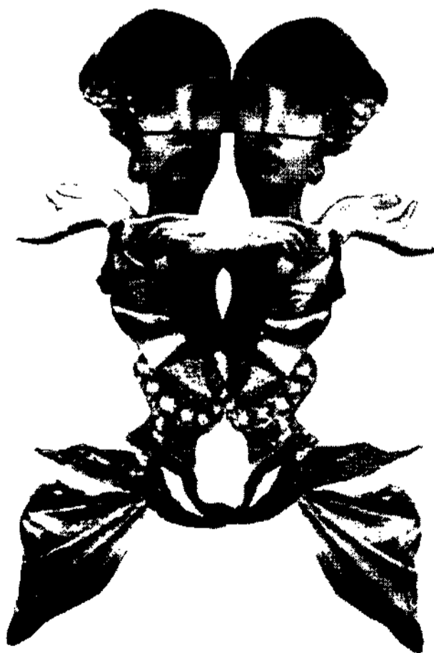
<그림 7> Esdar Maren <Fashion illustration next>

패션 일러스트레이션에 있어서도 꼴라주 기법은 다양한 표현기법의 전개와 실험적인 시도의 추구로 독자적인 예술영역을 구축하는데 다양한 가능성을 부여하고 있다. 꼴라주 기법은 종이뿐만 아니라 재료 선택의 제한 없이 오브제를 이용함으로써 색다른 소재의 의외성으로 패션 일러스트레이션에 조형 원리를 부여하며 패션 메시지를 보다 효과 적으로 전달할 수 있다. 팝 아트는 오브제에 의한 꼴라주 기법으로 단순히 그린다든 관념에서 벗어나 다양한 기법과 소재의 선택, 입체적 표현, 매체의 혼합으로 현대 패션 일러스트레이션의 표현양식에 있어서 새로운 가능성을 제시하였다. 평면 오브제를 이용한 꼴라주는 색지류, 인쇄물, 스크린 톤, 사진 등 일상적인 소재를 회화적인 소재와 결합시켜 사용함으로써 드로잉적 일러스트레이션의 표현 한계를 넘어 복합적인 패션 이미지를 효과적으로 전달할 수 있었다(그림 7). 특히 패션 일러스트레이션에 기존의 팝 아트 작가들 앤디 워홀이나 로이 리히텐 슈타인의 작업 방법을 응용하여 스