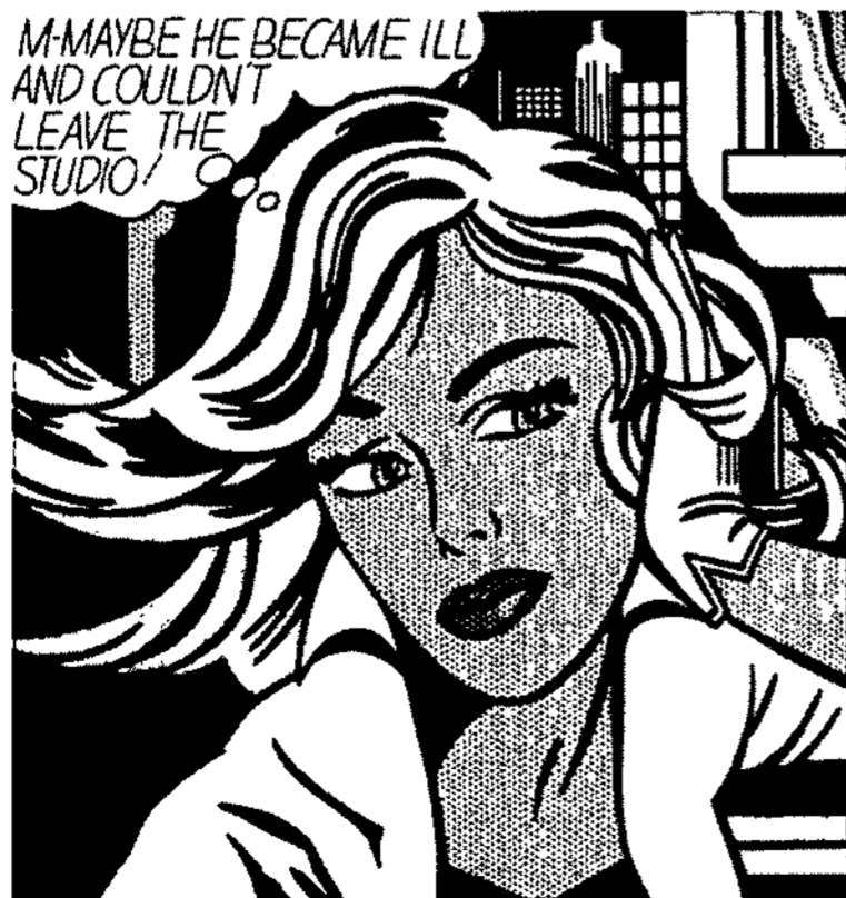
<그림 3> Roy Lichtenstein의 작품 <The Story of Modern Art> Norbert Lynton

앤디 워홀(Andy Warhol)은 실크스크린 기술을 동원하여 이미지를 기계적으로 복사하였고(경지현, 2002) 로이 리히텐슈타인(Roy Lichtenstein)은 환등기를 써서 만화를 세밀하게 복사하였다(김민자, 1986), (그림 3, 4).