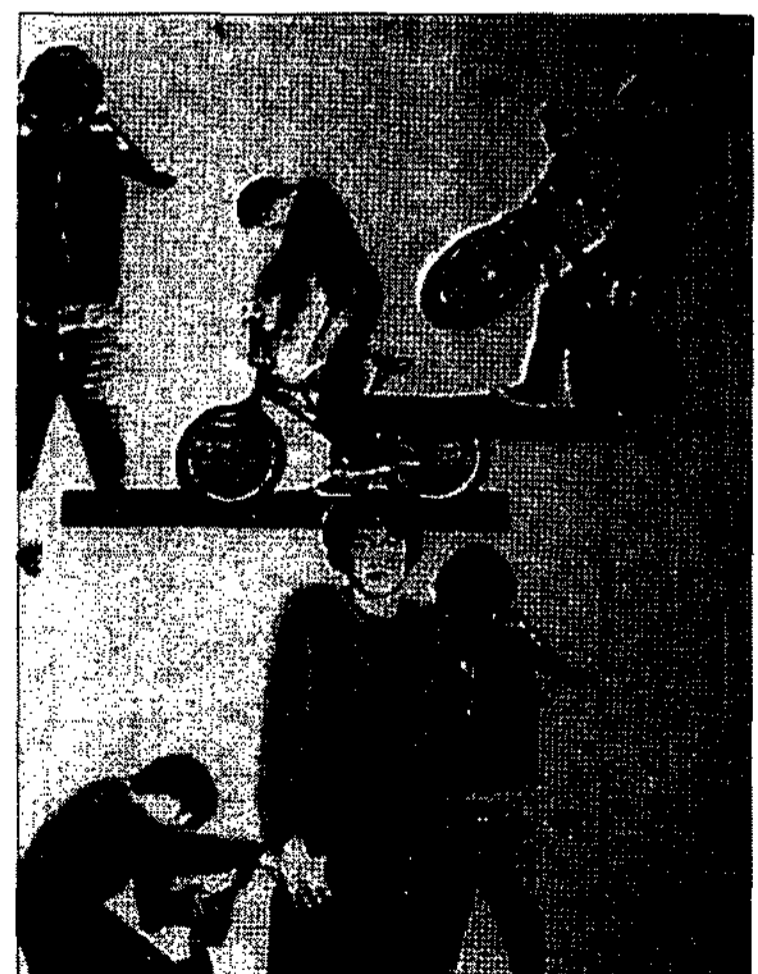
<그림 9> Gibb Kate <Fashion illustration next>