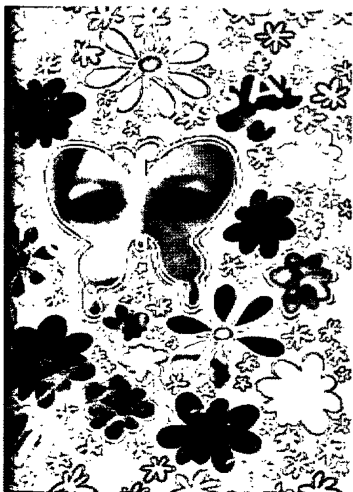
<그림 10> Ito Keiji <Fashion illustration next>

패션 일러스트에서 보여지는 포토몽타주 기법을 컴퓨터 그래픽을 활용한 작품 사례를 중심으로 합성 기법, 리터칭 기법, 필터링 기법으로 나누어 볼 수 있다. 패션 일러스트레이션에서 보여지는 포토몽타주 기법은 먼저, 컴퓨터 그래픽을 활용한 패션 일러스트레이션에서 가장 일반적으로 많이 사용되는 방법 중 하나인 합성기법이 있다. <그림 11>는 서로 다른 이미지를 부분적으로 분리하여 합치거나 겹치는 합성을 통한 새로운 이미지의 표현이다. 또한 사진위에 임의의 색상이나 선명도 등의 부분적인 색상 변화를 주는 효과인 리터칭 기법이 있다. 이러한 리터칭 기