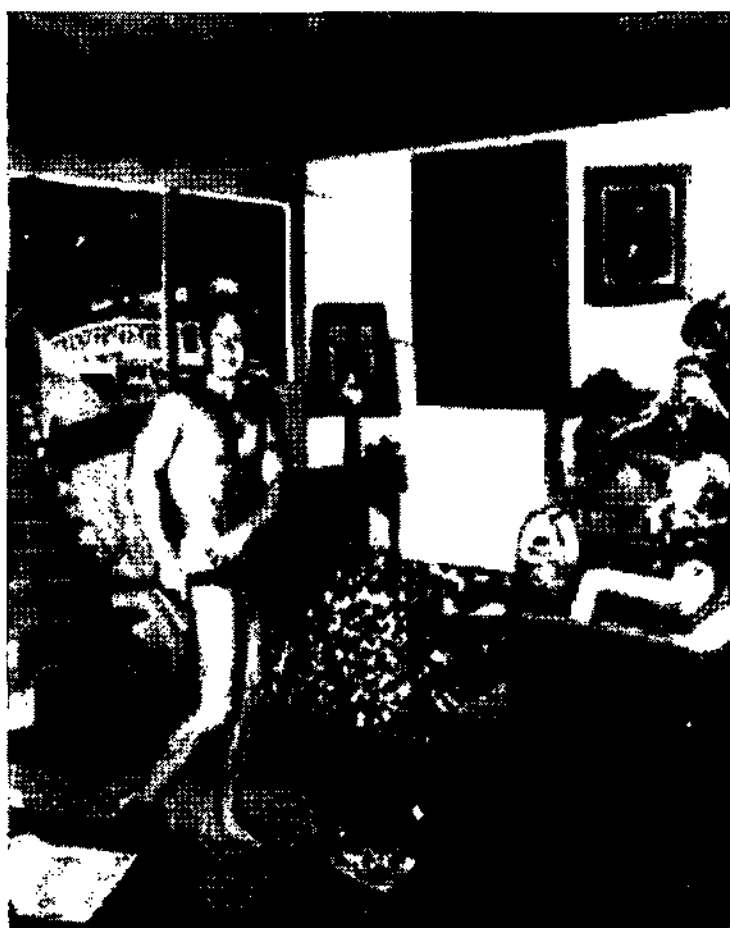
<그림 5> Richard Hamilton의 작품 <Pop Art> Edward Lucie-Smith