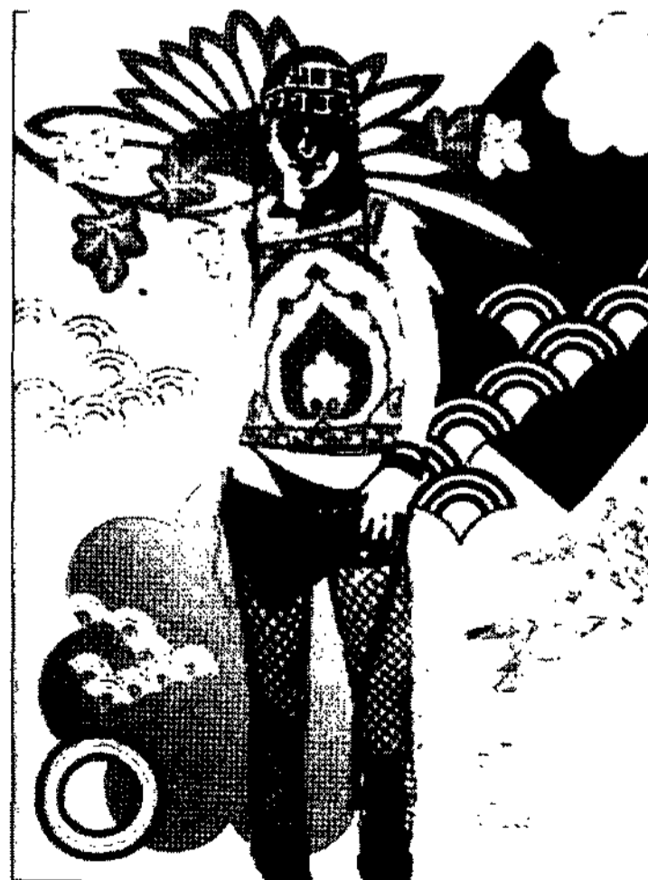
<그림 8> Goodall Jasper <Fashion illustration next>