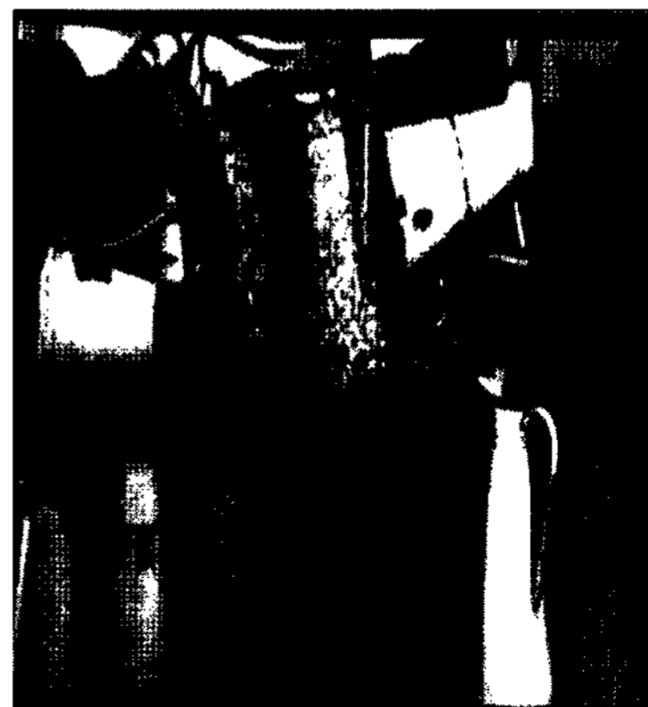
<그림 2> Arman의 작품 <Pop Art> Edward Lucie-Smith