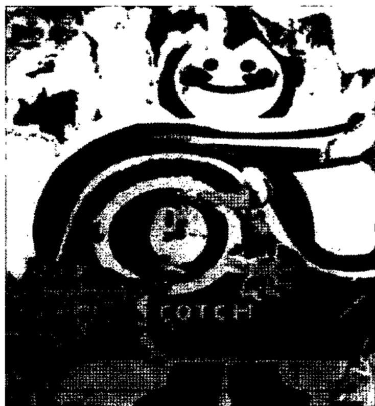
<그림 1> Daniel Spoerri의 작품 <Pop Art> Edward Lucie-Smith

그러나 팝 아트는 이러한 단편적이고 사전적인 정의로서는 그 본질 파악이 도저히 불가능하다. 그것은 팝 아트라는 양식이 형식이나 내용뿐만 아니라 사회적인 맥락에서도 매우 복잡하게 전개되었기 때문이다. 팝 아트가 출현한 1960년대는 서구 자본주의 체제가 안정기에 접어든 시기였다고 볼 수 있다. 이러한 상황 하에 대량생산 체제와 대량 소비, 그리고 매