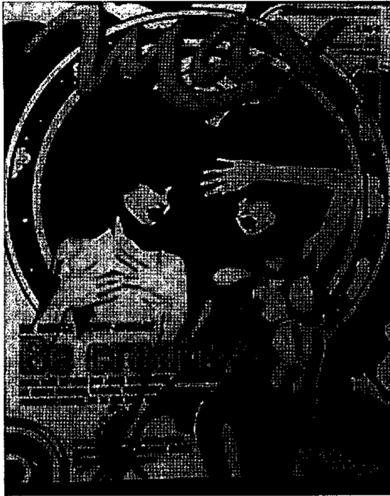
<그림 13> Max 잡지 표지, 2005