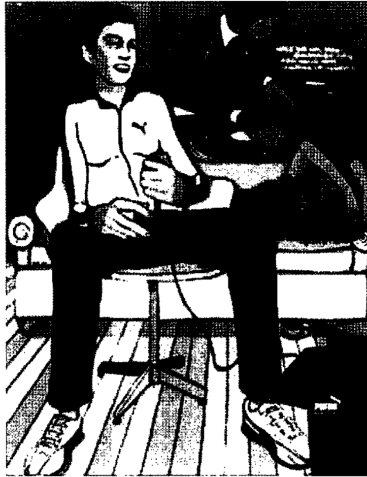
<그림 14> Puma 광고-Vogue, 2006, 5