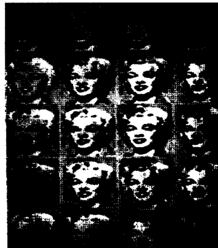
<그림 4> Andy Warhol의 작품 <The Story of Modern Art> Norbert Lynton