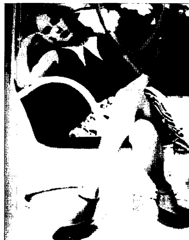
<그림 6> Dries Van Noten <Fashion illustration next>