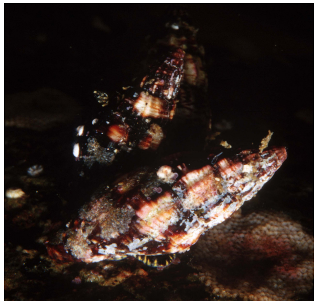
Fig. 2. Lateral view of Pisaniinae sp. from Dokdo Island, Korea in 29 August 2007.

Hima fratercula fratercula (Dunker, 1860) 검은줄 좁쌀무늬고둥 Material examined: n = 3, max SL = 11.1 mm, tidepool, intertidal area, 20 May 2007.