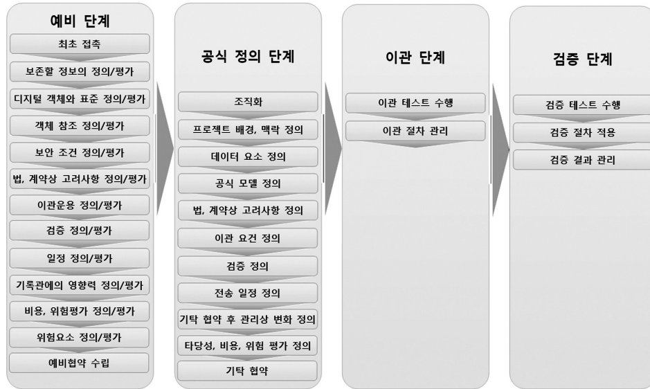
〈그림 3〉 CCSDS 생산자 - 기록관 인터페이스 방법론 표준 제안

록물의 특성과 수량 등을 고려하고 함께 이관 일정 및 방법에 대한 예비 협약을 수립한다.