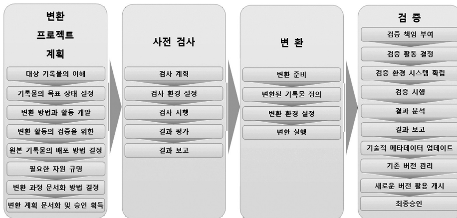
〈그림 1〉 ISO 전자기록물 변환 프로세스의 변환 절차

검증 단계는 변환된 데이터의 무결성 및 진본성에 대하여 계획에 맞추어 확인하고, 보고하는 단계이다.