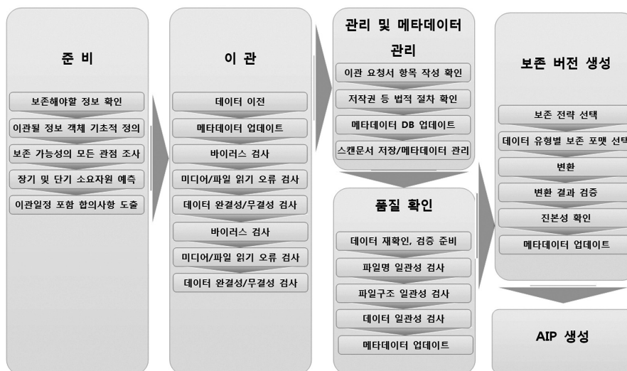
〈그림 2〉 AHDS 이관 절차 프레임워크