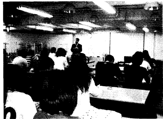
그림 1. 의류제품 생산관리 전문가 양성 과정

-교육담당자: 김순분, 남윤자, 이형숙, 최경미, 김진선, 김 정규, 유지선, 송병호