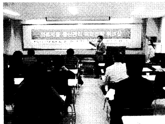
그림 3. 의류제품 생산관리 미래 전략 워크샵