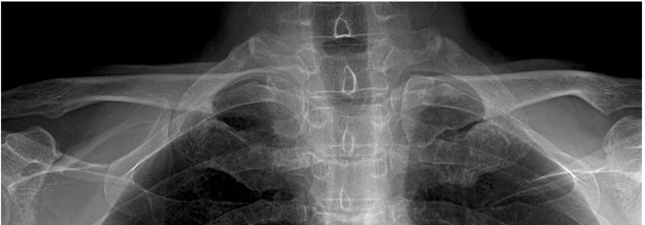
Fig. 3. The 2-year follow up posteroanterior clavicular radiograph shows no specific findings.

4주 시행 후 통증, 압통 및 감염 소견이 소실되었고, C-반응성 단백 수치도 정상화되어 경구로 동일 성분의 항생제를 추가로 2주간 투여하였다. 치료 후 2년 추시상 우측 흉쇄 관절부 통증 및 우측 견관절부 운동 제한은 없었으며 단순 방사선 검사에서도 특이 소견이 없었다(Fig. 3).