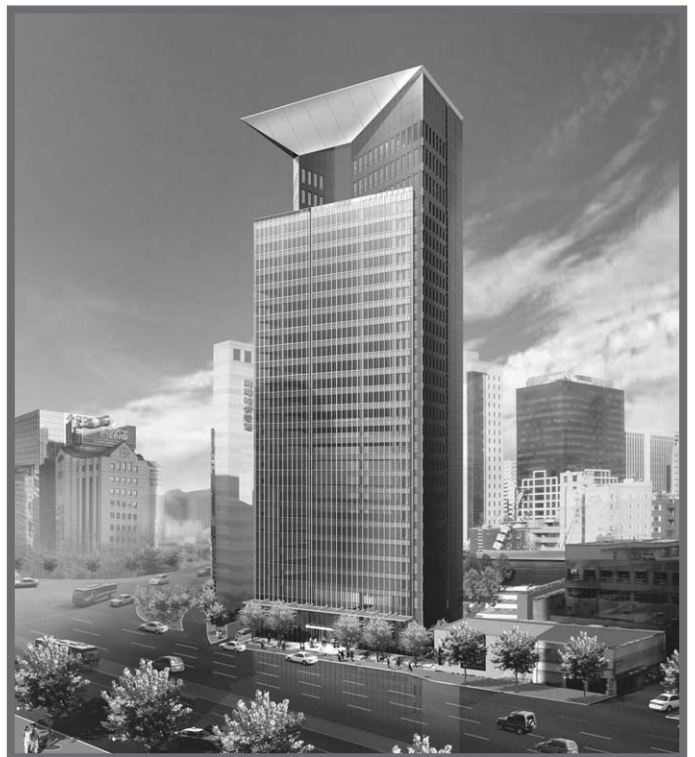
메리츠타워 / (주)상원구조기술사사무소