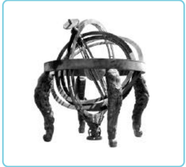
40cm, 8.9cm , 2 가 , 가 (時報)