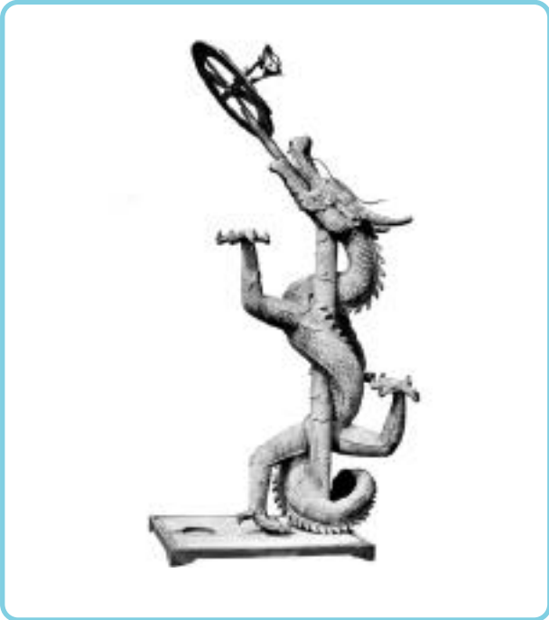
百刻環), (星晷百刻環) (每度) 4 (周天度:公轉度) (百刻: 12 ) (每刻) 6 (小定時儀)