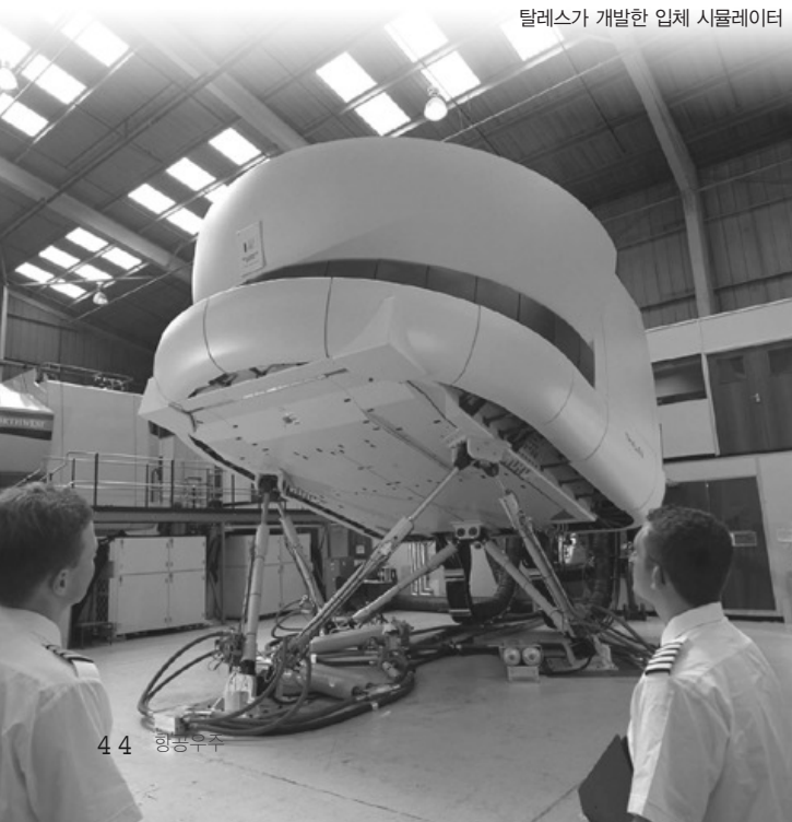
탈레스가 개발한 입체 시뮬레이터

탈레스는 탐지 및 사격 통제 레이더, 위협 탐지 및 자체 방어를 위한 전자전 시스템, 항법/공격 시스템 컴퓨터 그리고 광전자 장비 등을 포함하는 전투기를 위한 완벽한 임무 전자장비 패키지를