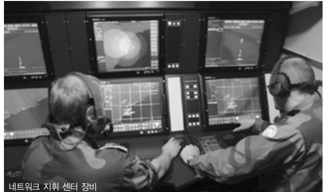
네트워크 지휘 센터 장비

공급하고 있다. 탈레스는 제작사 및 최종 고객과 긴밀하게 공동으로 일하는 신행 항공기 사업에 모든 서브시스템을 공급하고 있다.