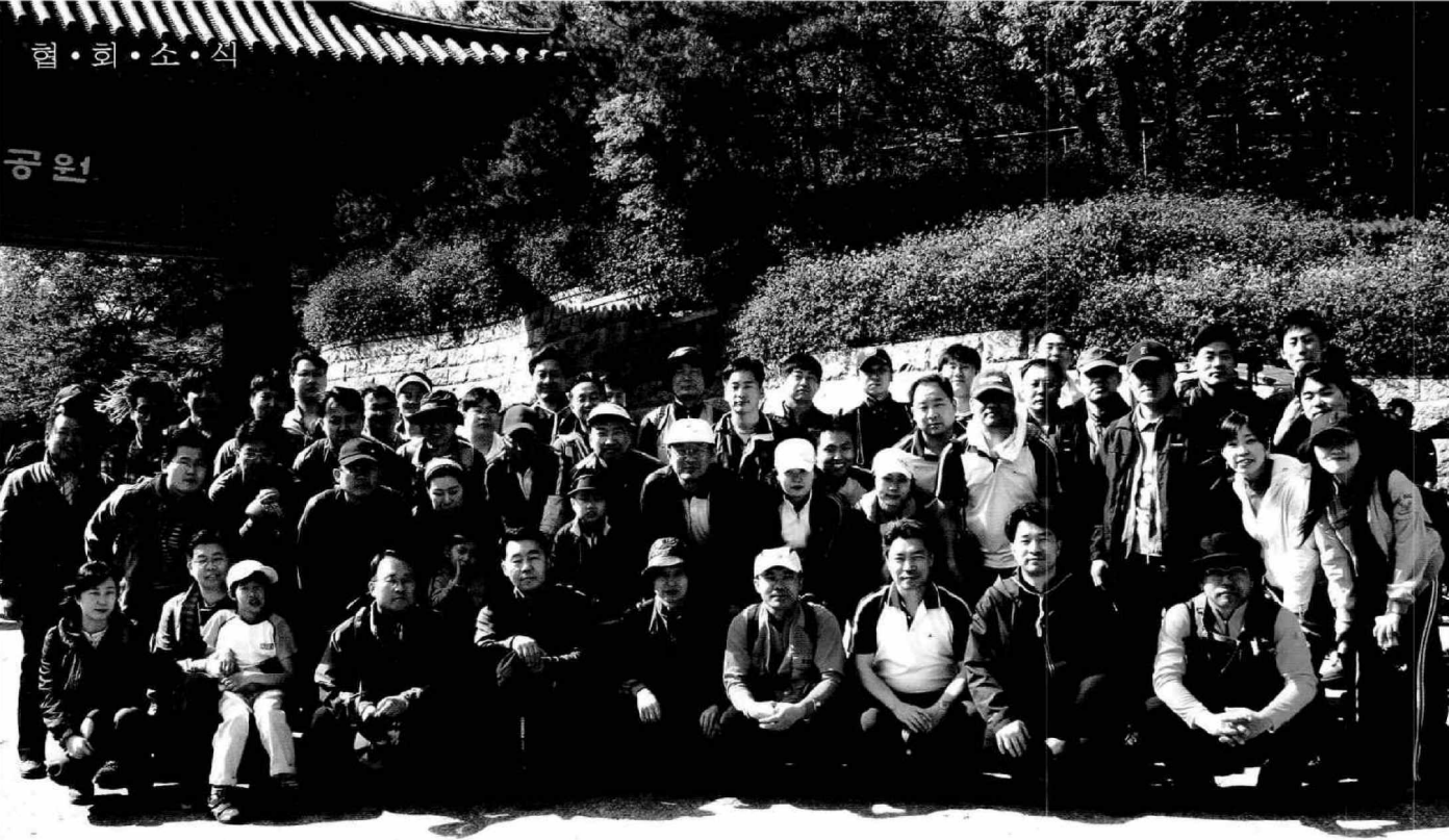
▲ 관악산 입구에서