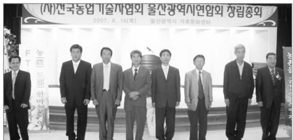
▲ 울산광역시창립총회 임원 인사