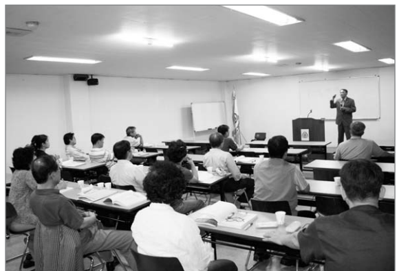
▲ 웰빙 농사교육 제1기 강의