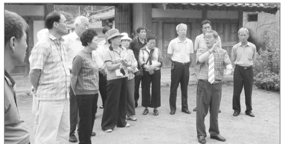
▲ 제8기 최고지도자과정 6차 - 마을 둘러보기

오는 8월 7일부터 9일까지 6회차 교육을 경남 사천 비봉내마을과 남해 다랭이마을, 두모마을에서 실시하며 마지막 7회차는 8월 29일에서 31일까지 본 협회에서 그동안 공부한 이론과 실습을 바탕으로 자신의 마을과 지역의 마스터플랜을 작성하여 발표하고 수료식을 할 예정이다. ☺