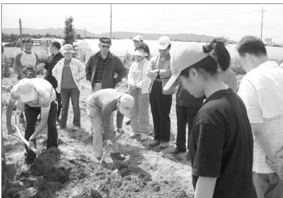
▲ 웰빙 농사교육 제1기 농장실습