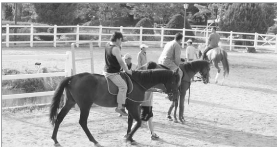
▲ 제4기 말 산업 전문가 교육(승마실습관경)