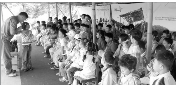
▲ 울산시 초등학교생들의 친구들과 떠나는 신나는 농촌체험 -대나무 피리블기