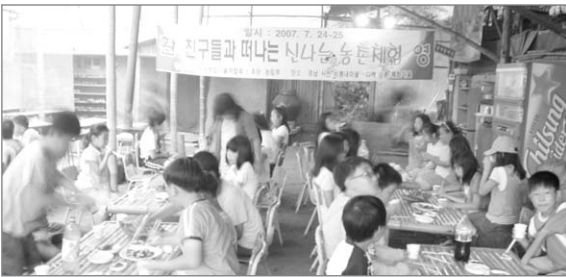
▲ 울산시 초등학교생들의 친구들과 떠나는 신나는 농촌체험

우리협회에서는 지난 7월 24일(화)부터 25일(수)까지 울산 병영, 명정, 상진, 일산, 옥성초등학교 기초생활수급대상자 자녀들을 대상으로 경남 사천의 비봉내마을, 상정 녹색농촌체험마을, 비토어촌체험마을 등에서 “친구들과 떠나는 신나는 농촌체험”을 주제로 농촌체험행사를 실시하였다. “교육복지차원에서 여러 가지 열악한 환경 속에서 자라는 어린이들이 자연 속에서 정서를 함양하여 건강한 인격체로 자라나게 하는데 기여하고자” 실시한 이번 농촌 체험 행사에 초등학교생 70명과 지도교사 5명이 참여하여, 대나무 삼림욕 체험, 허수아비 만들기, 대나무 뗏목타기, 고추 따기, 옥수수 따기, 대나무 피리 및 물총 만들기 등 도시에서 자라는 어린이들이 체험하기 어려운 내용으로 구성되어 의미 있는 행사가 되도록 하였다. ㉞