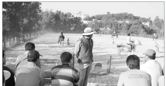
▲ 제4기 말 산업 전문가 교육(승마실습관경)