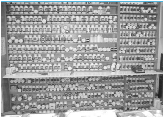
그림 3. 일반 한의원의 비치되어 있는 한약제

또한, 현재 이와 같은 제제를 동물병원에서 일부 수의사들도 사용하고 있다(그림 4).