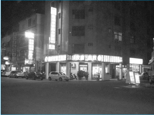
그림 10. 대만 묘을현 중형 동물병원

백화점도 같이 운영하고 있었고, 중형 병원(그림 10) 및 소형 병원(그림 11)이었다.