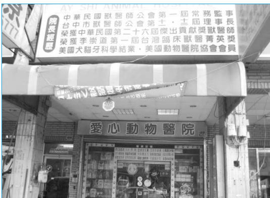
그림 8. 대만 태중시 애심동물병원

그리고 묘율시에는 6개의 동물병원이 있으나, 이 중 세 곳의 동물병원을 돌아볼 수 있었는데, 체재한 영창동물병원(그림 9)은 약 300평의 규모의 대형 병원으로, 진료시설도 잘 갖추고 애견용품