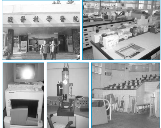
그림 2. 국립 중흥대학 시설(상단 좌: 부속동물병원, 상단우: 실험실 하단좌: 동물병원 디지털 X-ray, 하단중: 투과형 전자현미경 및 하단우: 대동물 계단식 강의실).