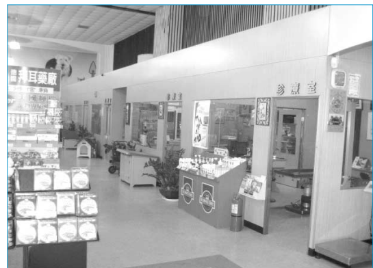
그림 9. 대만 묘율현 대형 동물병원(영창동물병원)