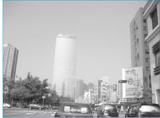
그림 7. 대만의 태중시 전경