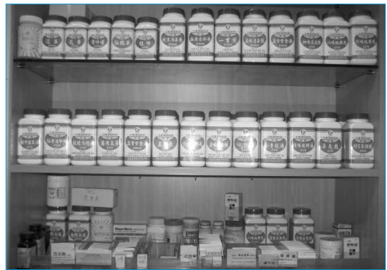
그림 4. 동물병원에서 사용하고 있는 한약제.