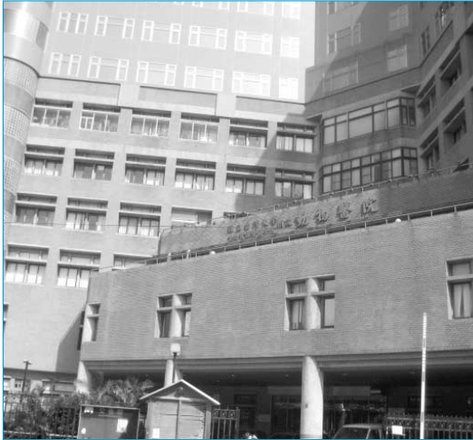
그림 1. 대만대학 수의학과 부속 동물병원 전경.

수의학과의 한 part로 4년제 수의학 교육이 시작되었다. 1959년 5년제 과정이 시작되었으며, 석사과정(1968년) 및 박사과정(1977년)이 각각 설치되어 운영되고 있다.