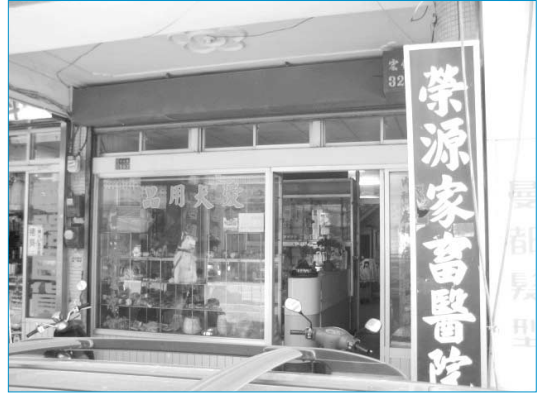
그림 11. 대만 묘을현 소형 동물병원

또한 가금은 120,004,000수(닭, 오리, 거위, 칠면조 포함)이다.