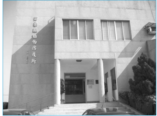
그림 5. 묘율현 동물방역소