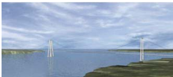
[그림 6] 카카오교 조감도

시공 중에 있으며, 칠레에서는 최대 경간장 1,100의 다경간 현수교인 카카오교가 설계 중에 있다[그림 6].