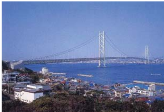
[사진 13] 아카시대교 전경