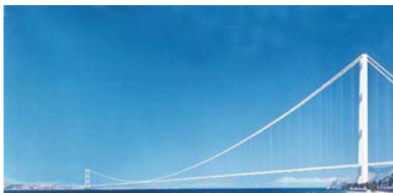
[그림 5] 메시나교 조감도