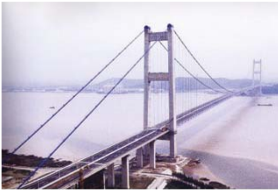
[사진 15] 장연양쯔강교 전경

식이다. 1999년에는 세계 최초로 세계의 현수교량이 연속한 쿠루시마 대교가 완공되었다[사진 16]. 이중 쿠루시마 제2대교와 제3대교가 최대 경간장 1,020, 1,030m의