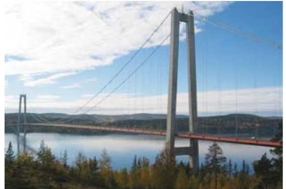
[사진 12] 하이코스트교 전경