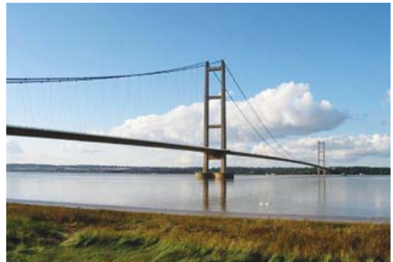
[사진 8] 험버교 전경