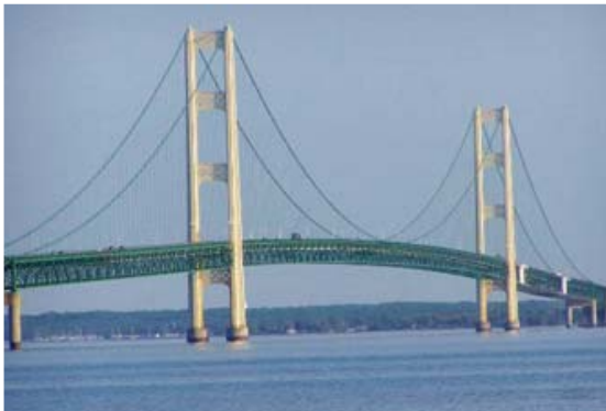
[사진 3] 매키낙교 전경

기록되었다. 이 교량의 주탑 높이는 156m이고, 보강형의 제원은 23.8m×8.4m이며, 최대 항로고는 45m이다. 이 교량은 중차량의 통행을 위하여 보강공사가 진행되기도 하였다. 또한 같은 해에 미국의 뉴욕만의 베라자노교는 지간장 1,298m, 주탑높이 210m로 준공되었다[사진 5]. 보강형의 제원은 31.41m×7.3m이었고, 총12차선이며, 최대 항로고는 69m이다. 1966년 8월에는 영국의 타구스강을 가로지르는 타구스강교가 준공되었다[사진 6]. 이 교량의 지간장은 1,013m으로써 1970년대까지 유럽에서 지간장이 가장 긴 현수교였고, 주탑의 높이도 190m 이었다. 보강형의 높이는 21.0m×10.7m이고, 최대 항로고는 70m로 현재까지도 세계에서 가장 높은 항