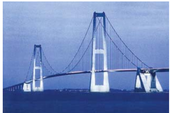
[사진 14] 그레이트 벨트 이스트교 전경