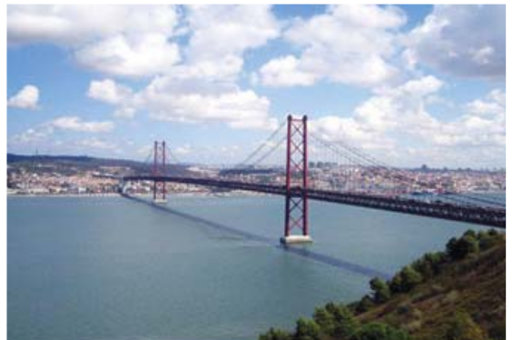
[사진 6] 타구스강교 전경