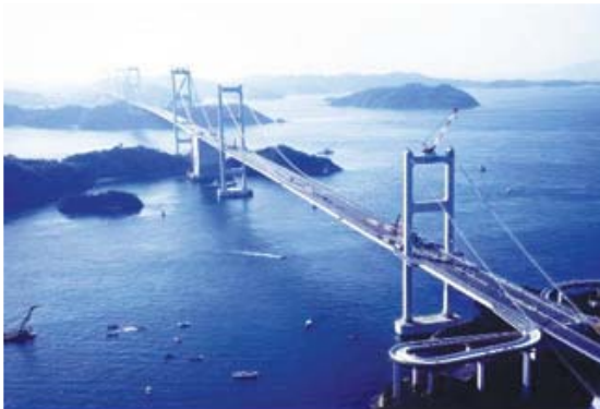
[사진 16] 쿠루시마대교 전경