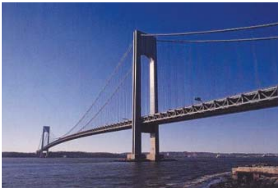
[사진 5] 베라자노교 전경

로고를 기록하고 있다. 1990년대에 보강공사를 착공하였는데 기존의 2개 현수케이블에 2개의 케이블을 증설하여 더블데크로 개선하였다. 하부데크는 철도교, 상부데크는 도로교로 사용되고 있다.