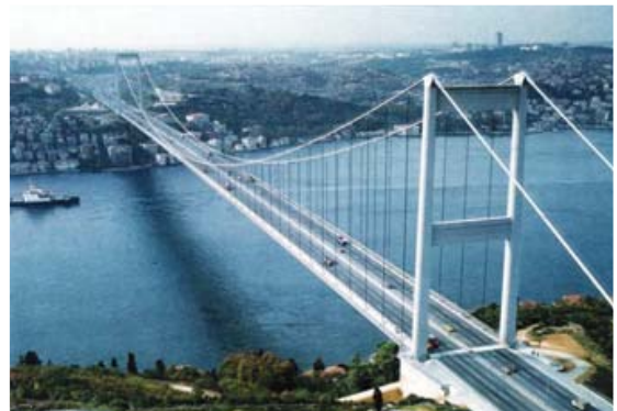
[사진 10] 파티히 술탄 마호메드교 전경