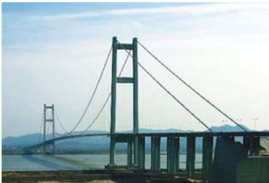
[사진 17] 룬양교 전경

장대 현수교이며, 공유 앵커 블록을 가지고 있는 특징을 가진다. 중국의 룬양교는 2005년 완공되었다. 왕복 6차선이며 보강형의 제원은 39.2m×3.0m이며, 최대 경간장이 1,490m로 현존하는 중국 교량 중에 가장 긴 교량이다[사진 17].