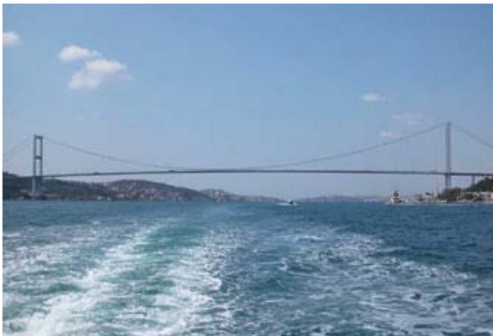
[사진 7] 제1보스포러스교 전경

1997년 4월 중국 홍콩에서는 약 5년간의 공사 기간을 거쳐, 세계에서 가장 긴 지간장을 가지는 도로·철도 병