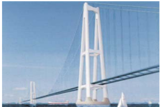
[그림 3] 지브롤터해협대교 조감도