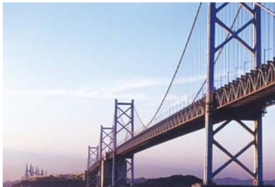
[사진 9] 미나비비산 세토대교 전경