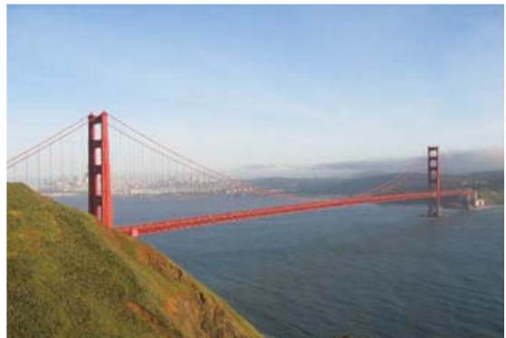
[사진 2] 골든게이트교 전경