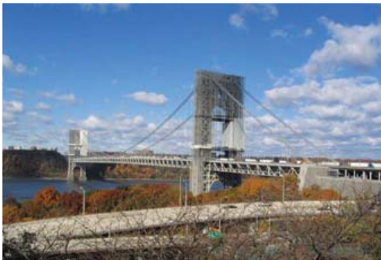
[사진 1] 최초 장대 현수교(조지워싱턴교)

1957년에는 미시건호와 휴런호를 연결하는 시간장 1,158m, 교량 총연장 5.8km인 매키낙교가 준공되었다 [사진 3]. 이 교량의 측경간장은 549m이며 주탑의 높이는 168m이었다. 매키낙교는 세계에서 가장 견고한 교량으로 알려져 있는데, 시속 280m/s에 달하는 풍속에도 저항할 수 있도록 설계되었다. 총4차선 중 중앙의 2차선은 오픈 그리드로 설계되었고, 보강형의 제원은 20.7m × 11.7m이며, 최대 항로고는 45m이다. 1964년에는 9월 영국의 스코틀랜드에 1,006m의 최대 경간장을 갖는 포스로드교가 준공되었다[사진 4]. 이 교량의 준공으로 인하여 유럽에서도 최초로 1,000m 이상의 장대 현수교가