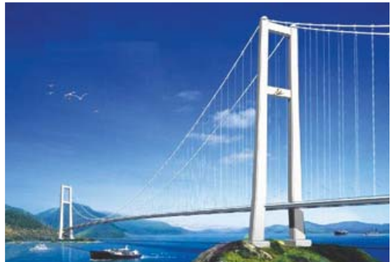
[그림 2] 시오우먼교 조감도

미래에 준공이 기대되는 1,000m 이상의 장대 현수교로는 먼저, 최대 경간장 1,650m로 1,624m의 그레이트 벨트 이스트교 보다 길며, 세계 3위의 현수교인 시오우먼교가 현재 중국에서 건설 중에 있으며 2008년 완공될