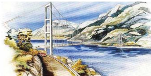
[그림 4] 하르당게르교 조감도

또한, 중국에서는 1,418m의 칭령교, 1,280m의 양러 양쯔강교, 1,108m의 항푸교 및 1,088m의 빠이링거교가