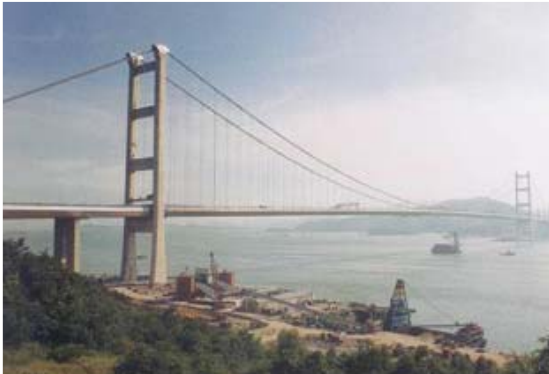
[사진 11] 칭마교 전경

협을 통과한다. 주경간의 길이가 1,991m로 세계 최장의 현수교이며, 왕복 6차선 30m의 폭으로 설계된 보강형은 대형 선박이 해협을 자유롭게 통과하도록 최대 항로를 65m로 하였다. 1998년 6월 덴마크에서는 지간장이 1,624m로 세계에서 두 번째로 긴 그레이트 벨트 이스트교가 준공되었다[사진 14]. 이 교량은 주탑 높이가 254m로써 콘크리트 주탑으로는 세계 최고 높이를 자랑한다. 보강형의 제원은 31.0m×4.0m이고, 강박스 형식이며, 그 길이가 2,694m로 강박스 연속 보강형 중 세계 최장이다. 중국의 장엔양쯔강교는지간장이 1,385m이고, 1999년 9월에 완공 되었다[사진 15]. 보강형의 제원은 36.0m×3.5m이며, 왕복 6차선의 유선형 강박스 형