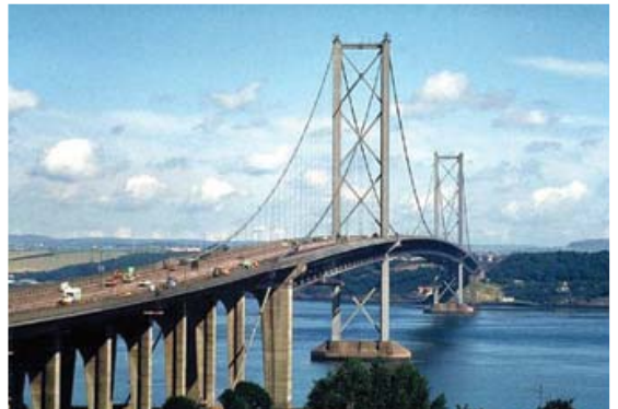
[사진 4] 포스루드교 전경

1973년 10월 터키의 이스탄불에는 지간장이 1,074m인 보스포루스교가 준공되었으며, 이로서 유럽과 아시아 대륙을 최초로 연결하는 현수교가 건설되었다[사진 7]. 주탑 높이가 165m인 이 교량은 중앙경간만 행여가 있으며 강박스보강형의 제원은 28.0m×3.0m이다. 1981년 7월 영국에서 지간장이 1,410m에 달하는 험버교