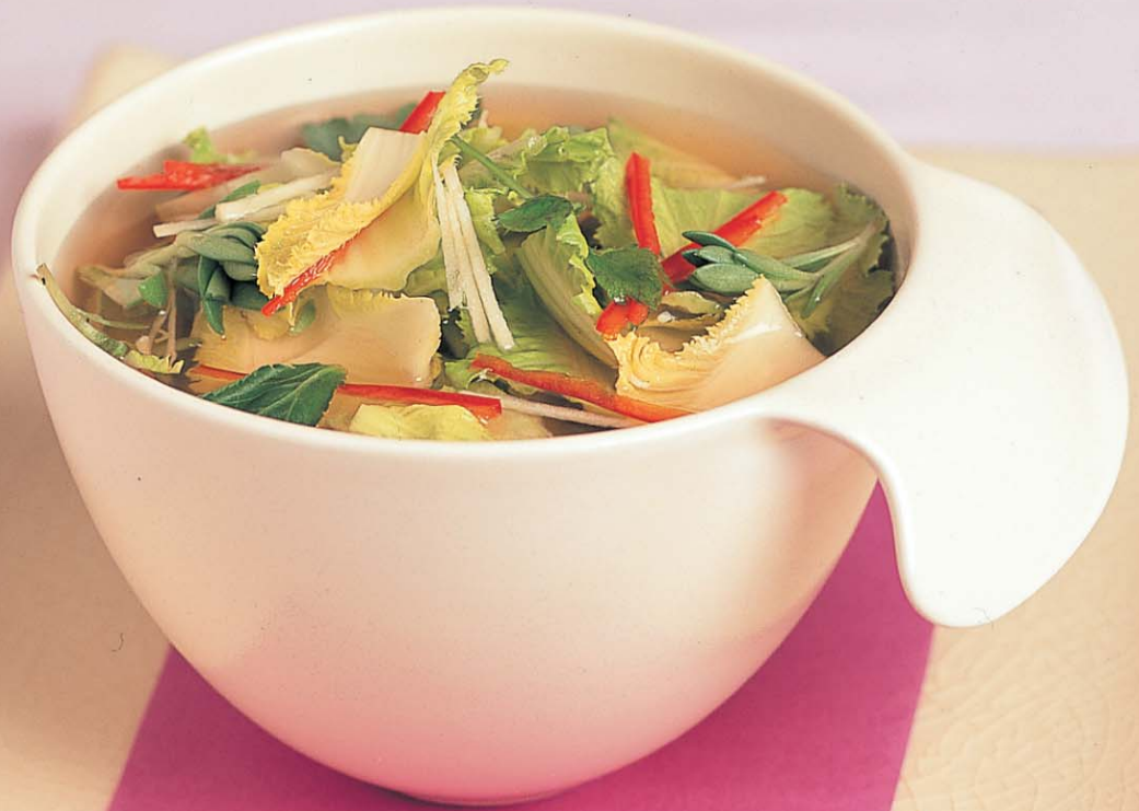
▲ 봄동참나물 물김치