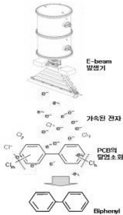
Fig. 1 가속된 전자빔에 의한 PCBs의 탈염소화 반응기구

여기 에너지로 변환된다. 전자는 피조사 분자에 비해 매우 작은 질량을 가지기 때문에 충돌시 적은 에너지만 소실되며, 가속된 전자의 에너지가 모두 소진될 때까지 수많은 충돌을 하게 된다. 가속된 전자들에 의한 이와 같은 연쇄작용으로 1개의 전자로부터 생성되는 총 전자 수는 보통 약 십여 개에 이르며, 이와 같은 과정에서 수많은 이온, 라디칼, 여기상태의 분자 및 원자들이 생성되어 반응이 수초 내에 급격하게 일어나게 된다. 전자빔에 의하여 PCBs가 분해되는 반응을 도식화 하면 그림3과 같이 표현할 수 있으며, 양극의 전위차를 조절하면 결합에너지가 가장 작은 염소기만을 선택적으로 제거할 수 있다.