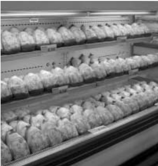
농협 양재동 하나로 마트에서 판매되고 있는 개체포장의 닭고기