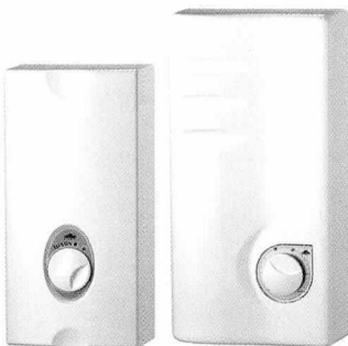
전기 순간 온수기

보다 편리한 생활환경을 이끌어 나가는 삼우에너지는 귀사와의 만남을 매우 기쁘게 생각하는 회사이다.