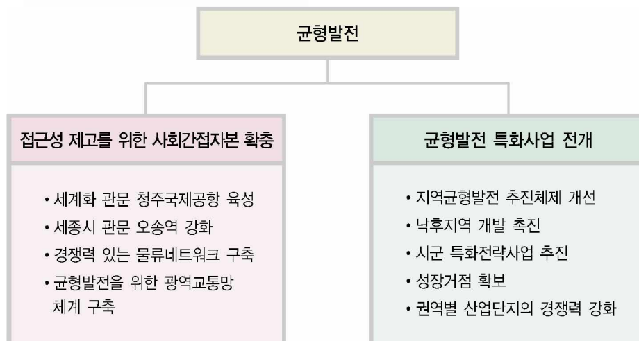
〈그림 5〉 균형발전 중점과제

사회간접자본 확충과 관련하여 청주국제공항 육성을 위한 계류장 등 시설 확장과 함께 국제정기노선을 5개 노선으로 확대하며 세종시 관문으로서의 오송역의 위상 강화를 위해 오송역사를 4층 10선 규모로 확대하는 사업을 추진하게 된다. 또한 경쟁력 있는 물류거점 육성을 위해 중부내륙화물기지를 조기에 완공하고 2010년까지 권역별 물류센터를 4개소로 확대 설치하게 된다. 광역교통망 체계 구축을 위해 청원-상주간 고속도로의 2007년 완공 및 고속도로 노선 확충 등 광역도로망 확대와 함께 중부내륙선 신설 등 광역철도망 확대 사업이 추진될 예정이다.