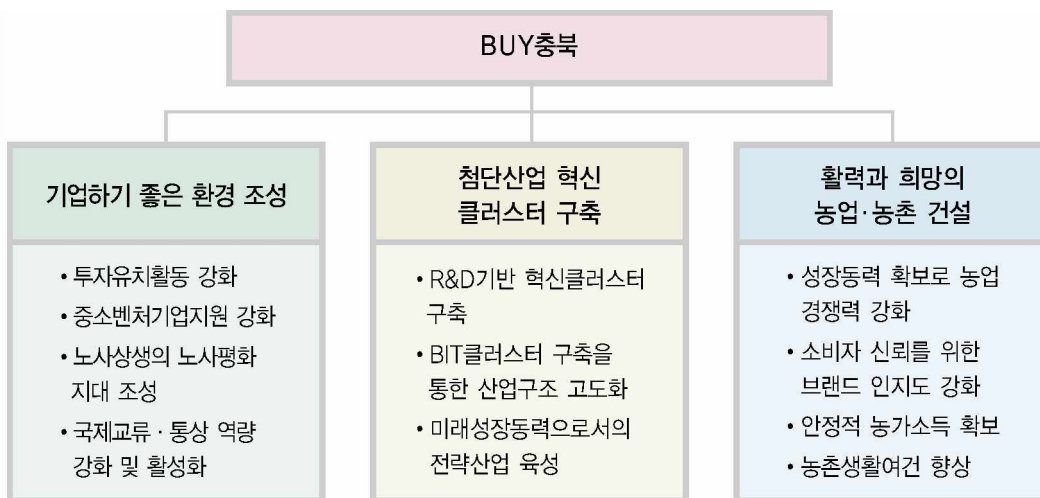
〈그림 3〉 BUY충북 중점과제

기업하기 좋은 환경조성 전략과 관련하여 민선4기 충북도정은 2009년까지 100억원의 투자진흥기금을 조성하고 기업들의 공장설립 및 기업에로요인 해소를 위한 one-stop서비스 지원체제를 강화하며, 적극적인 기업유치 활동 등 매력적인 투자환경 조성 및 공격적인 기업유치 전략의 추진을 통해 2010년 150개의 기업을 유치하는 것을 목표로 하고 있다. 또한, 우수기술력을 보유한 일류벤처기업을 2010년까지 50개사로 확대하여 지정 육성하고 기업들에 대한 신용보증지원 확대 및 글로벌 비즈니스 활성화를 통해 일류 중소·벤처기업 육성을 위한 지원체제를 구축하게 된다. 우리 지역을 노사가 상생하는 노사평화시대로 조성하기 위해 노사정 포럼을 통한 대화창구를 정례화하고 시군을 시작으로 2010년에는 충북 전 지역을 노사평화시대로 선포할 예정이다.