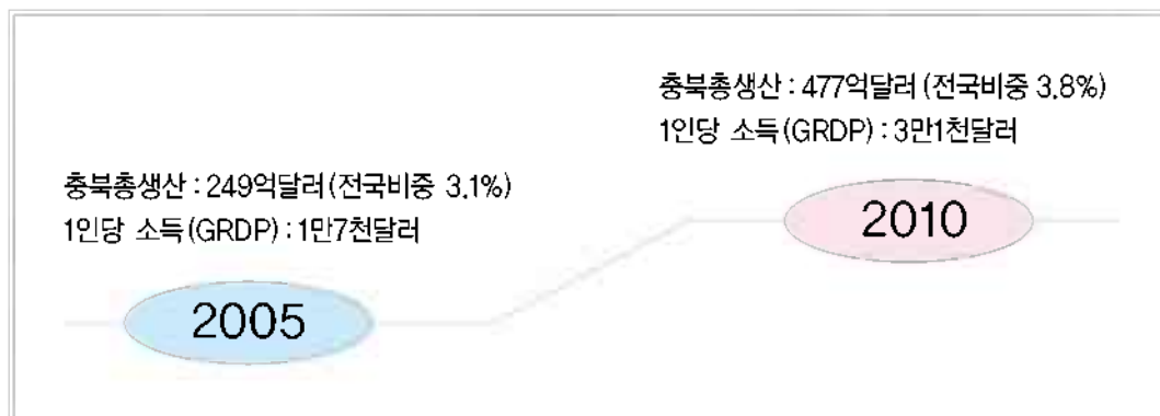
〈그림 2〉 경제특별도 건설의 정책목표

앞에 제시된 경제특별도 건설의 정책목표 달성을 위해서는 재정지출, 건축면적, 수출, 투자유치, 신규 일자리 창출 등 5대 핵심정책의 성공적 추진이 전제되어야 한다. 우선 2010년 재정지출은 2004년 4조 1,760억원 대비 1.5배 증가한 6조 2천억원으로 증액되어야 하며, 건축면적은 민선4기 기간동안 건축 연면적 총 37.7백만㎡(오창과학산업단지의 4배 규모)가 증가되어야 한다. 또한 2010년 수출액은 2005년 57억달러 대비 2.3배 증가한 130억달러로 증가되어야 하며, 투자유치와 관련하여 민선4기 동안 2조3천억원의 투자목표액을 달성하여야 한다. 마지막으로 2010년 153만 7천명으로서의 인구증가와 함께 민선 4기동안 6만1천여개의 신규일자리가 창출되어야 한다.