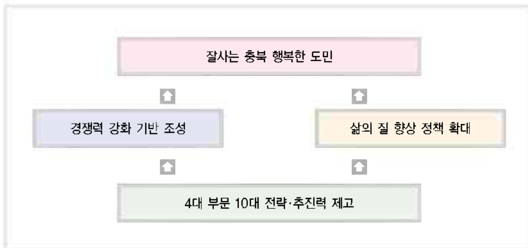
〈그림 1〉 민선4기 충북도정의 비전

「잘사는 충북 행복한 도민」의 비전은 모든 도민들이 경제특별도 건설을 통하여 경제적으로 풍요로운 삶을 영위하고 행복하게 살아가는 지역사회를 건설하는 것이다.