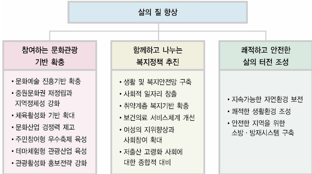
〈그림 6〉 삶의 질 향상 중점과제

함께하고 나누는 복지정책 추진 전략과 관련하여 도민종합복지정보망 구축, 긴급위기 취약계층 지원 확대, 사회복지 전담 공무원 확대 등 생활·복지 안전망을 구축하고, 노인일자리 창출, 장애인과 소외계층을 위한 일자리 창출, 여성의 경제활동 참여 확대 등 사회적 일자리 창출을 위한 사업을 전개하게 된다. 또한 경로당 프로그램 지원 확대, 교통약자의 이동권 확보를 위한 저상버스 확충, 요보호대상자의 세탁 지원 등 취약계층 복지기반을 확충해 나갈 계획이다. 보건 의료 서비스 체계 개선을 위해 노인전문병원 확충, 농어촌 의료서비스 개선사업 추진, 건강검진 및 의료비 지원 강화, 방역활동 강화, 미래사회 질병대비체제 확립, 건강도시 만들기 등의 사업이 추진된다. 여성의 지위향상과 사회참여 확대를 위해서는 여성인적자원개발 기본계획의 수립과 함께 여성발전기금 증액, 여성농업인 지원 농가도우미 확대, 보육조례 제정, 특수보육시설 확충, 결혼이주 여성 지원을 위한 인프라 구축 등의 사업이 추진된다. 기타 저출산 고령화 사회에 대한 종합적 대비로써 노인요양시설 인증제도 시행과 아동펀드 설립 등의 사업이 포함되어 있다.