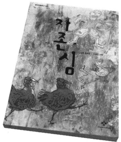
《자존심》 김남중 지음 | 이형진 그림 | 창비 | 171쪽 | 값 8,500원

기억을 환기시킨다. 이 두 축을 따라가는 작품집의 모든 이야기는 그 자체로 타자의 자존심을 찾아가는 경이로운 발견의 과정이며, 자신만의 자존심에 매달렸던 회한을 불러일으키는 무거운 자책의 과정이기도 하다.