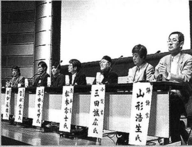
저작권 보호기간 연장 문제를 생각하는 국민회의 운영 사이트 및 심포지엄 장면