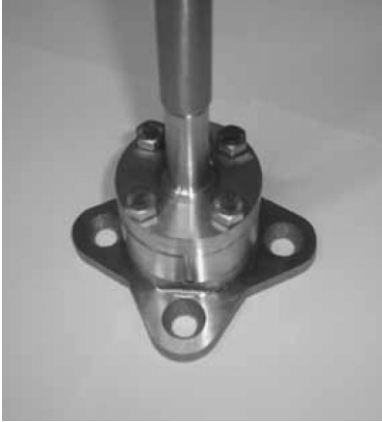
▲ 피뢰침 사진