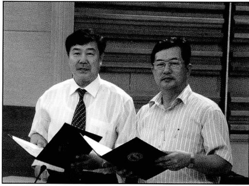
▲ 혁신 멘토링 계약 체결

지난 7월 28일 기획예산처 MPB홀에서 인천항부두관리 공사와 ‘혁신수준 향상을 위한 동반학습(Mentoring) 협약’을 체결하였다.