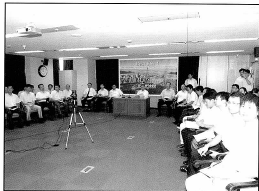
▲ 열린경영 열린마음 포럼 개최

혁신 아이디어를 제공하는 등 열띤 토론이 펼쳐졌으며, 특히 포럼 진행 모습이 영상회의시스템을 통해 전 지부에 방송되어 본부와 지부간의 교류가 활발해지는 계기를 마련하였다.