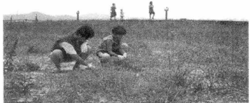
<사진 4> 달맞이꽃과 백령초 실태