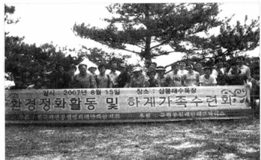
<사진 8> 행사 참여 단체 사진