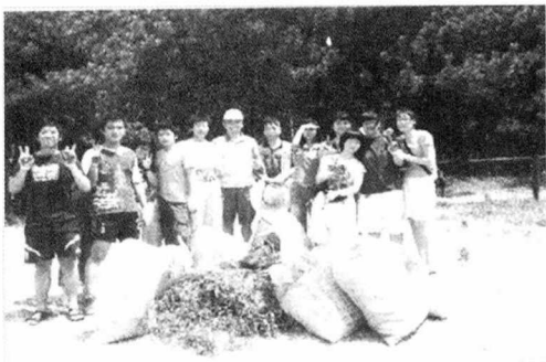
<사진 7> 작업 후의 보람