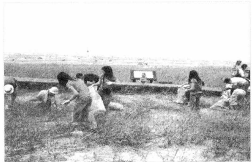
<사진 6> 외래식물 제거작업 중