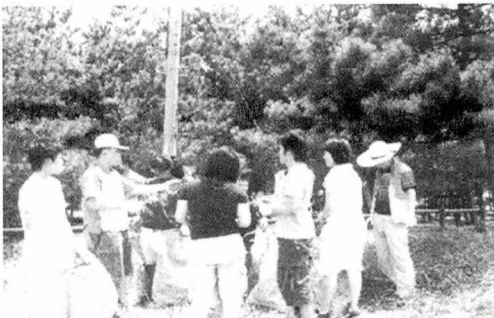
<사진 5> 사구식물과 외래식물 설명