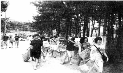
〈사진 1〉 송림 정화활동 1

그러나 최근 2~3년 사이 외래식물종인 달맞이꽃과 가칭 백령초(백령도에서 군부대를 중심으로 식생하였다 하여 붙인 이름. 최근 비교적 지리적으로 근접한 서해안이라서 이동 된 것으로 보임)