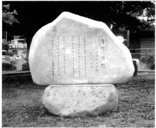
〈국립공원 주왕산 입구에 세워진 이상룡 시비〉