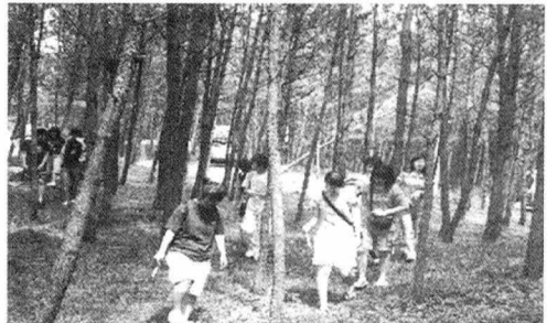
〈사진 2〉 송림 정화활동 2