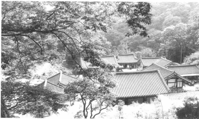
장곡사 전경 (2007. 7. 13)

앞서 살펴본바와 같이 우리 관광청양의 미래는 밝다. 자연의 숨결 속에 파묻어 놓은 훌륭한 보배를 갖고 가꾸어 자손만대에 내려줄 힘은 어디에서 올수 있는 것인지 스스로 자성하면서 창조정신과 개척정신이 새로운 관광청양군의 밝은 미래를 열어 줄 수 있는 원동력임을 강조하면서 “자기 맡은 일에 최선을 다하는 모습이 아름답다”는 선배들의 말씀에서 우리 모두는 “할 수 있다.”, “하면 된다.”는 강한 의지가 불가능을 가능케 하는 성공의 어머니로서 최고에 도전하는 으뜸 관광 청양군을 이룩할 수 있다.