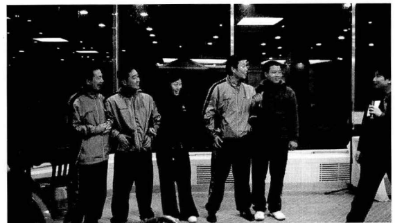
직원들과 함께 즐거운 레크리에이션

2008년을 대비한 주원산오리 워크샵이 2007년 11월 22일부터 23일까지, 1박 2일 일정으로 충주에 있는 충주호 리조트에서 개최되었다.