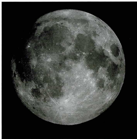
▶ 오는 추석에 뜨는 달과 위상 정도가 비슷한 달의 모습. 사진에서 달의 왼쪽 부분에 그림자가 드리워진 것을 볼 수 있다.