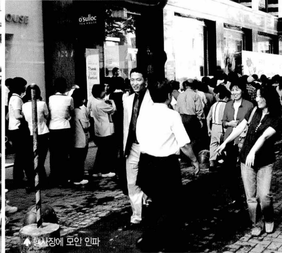
행사장에 모인 인파