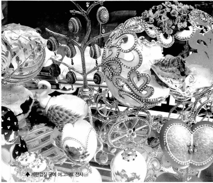
▲ 계란껍질 공예 에그아트 전시