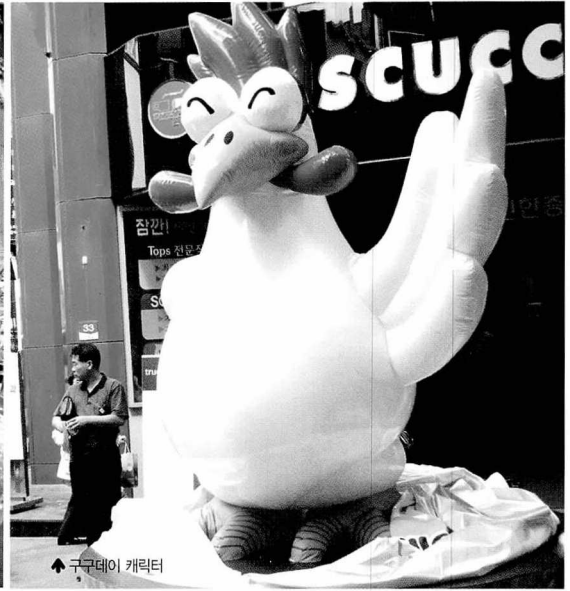
▲ 구구데이 캐릭터