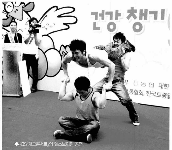
▲ KBS「개그콘서트」의 헬스보이팀 공연