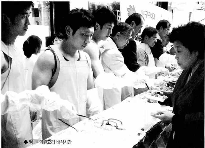
▲ 닭·계란요리 배식시간

특히, 닭·계란요리 시식 외에도 계란껍질을 이용한 공예작품을 직접 만들어보고 전시하는 이벤트와, KBS 「개그콘서트」의 <헬스보이>팀의 초청 공연도 함께 이루어져 웃음과 메시지가 있는 행사로 눈길을 끌었다.