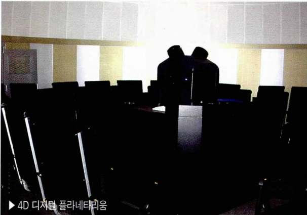
▶ 4D 디지털 플라네타리움