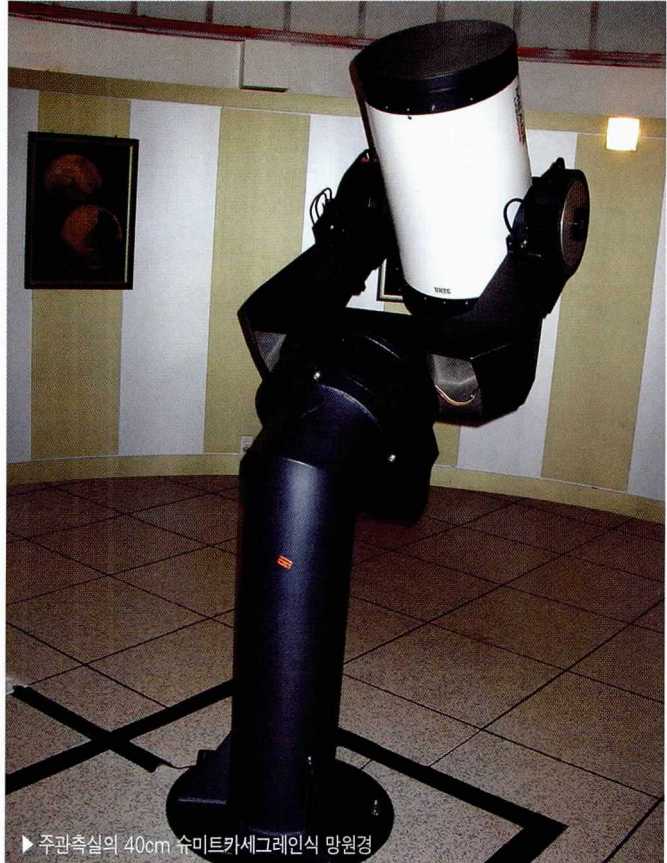
▶ 주관측실의 40cm 슈미트카세그레인식 망원경