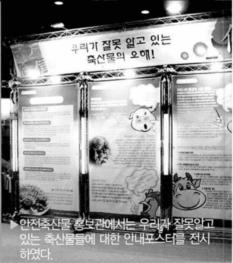
이날 행사에는 우리안전축산물 요리대회가 개최되었다