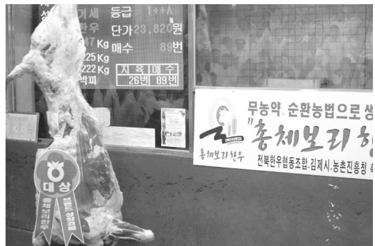
대상 출품축 경매