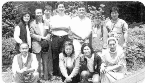
호스피스봉사팀 피정 중에