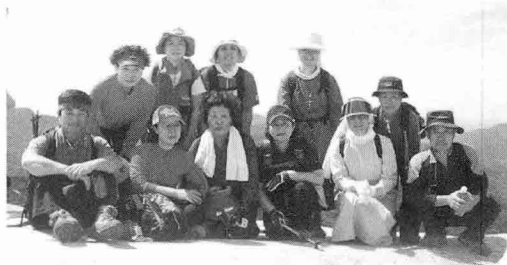
호스피스봉사팀 사파산 산행