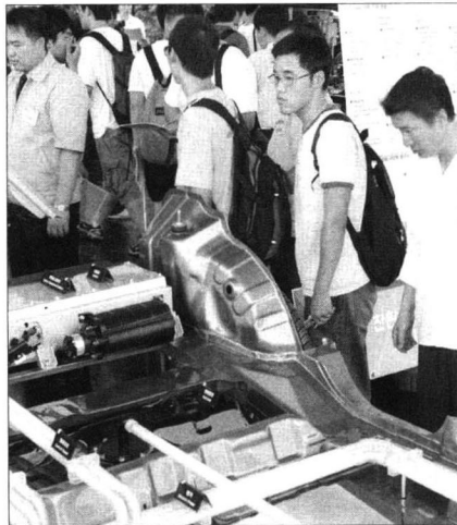
▲일반인들과 학생들이 하이브리드카 내부를 살펴보고 있다.

○내수용 뿐 아니라 전 세계적으로 LPG자동차가 보급되어 있는 국가로 LPG하이브리드카 수출이 가능할 것으로 기대 됨