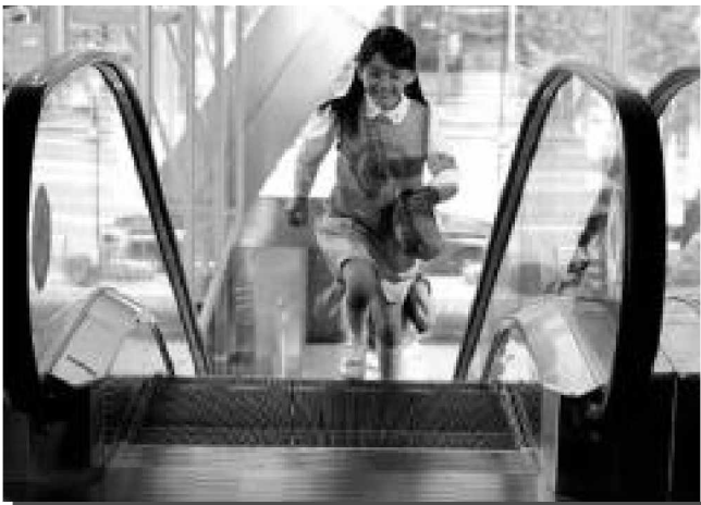
에스컬레이터에서 뛰는 등의 행동은 전도사고로 이어질 수 있어 위험하다.

한국승강기안전관리원이 지난 5년간('02~'06년) 승강기 안전사고를 분석한 결과, 전체 사고 14건 중 35.5%(7건)가 에스컬레이터 안전사고로 조사됐고, 이중 65.7%(50건)가 '지하철역사 에스컬레이터'에서 발생한 것으로 나타났다. 또한 지하철역사에서 발생한 76건의 에스컬레이터 안전사고 유형을 분석한 결과 ▲전도사고(넘어짐) 32건 ▲끼임 사고 10건 ▲기