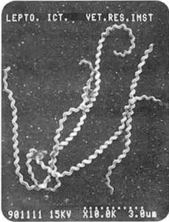
그림 1. 렙토스피라의 전자현미경 사진

렙토스피라는 병원성 렙토스피라 ( Leptospira interrogans ; 가축 또는 사람에서 질병을 유발)와 비병원성 렙토스피라 ( Leptospira biflexa ; 질병을 유발하지 않고 물, 습지, 바다