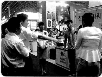
▲ 행사장의 꽃 이벤트