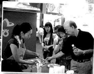
▲ 맛 좀 보고 갈까?