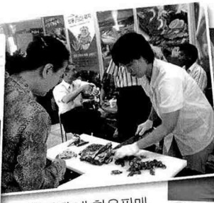
▲ 행사장 내 한우판매