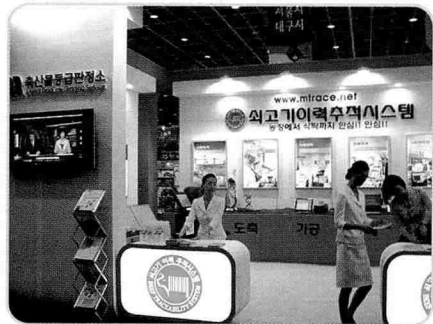
▲ 쇠고기 이력추적시스템관