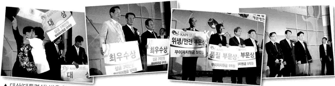
▲ 대상(대통령상) 받은 횡성 한우