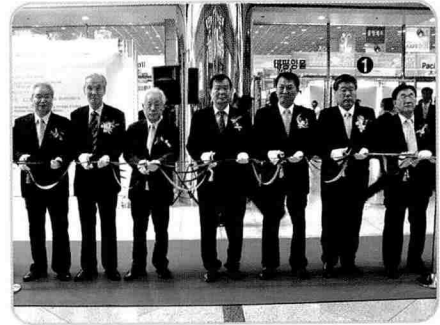
▲ 박람회 시작은 테이프커팅으로