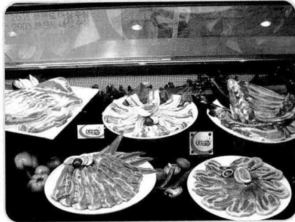
▲ 포크밸리의 싱싱함