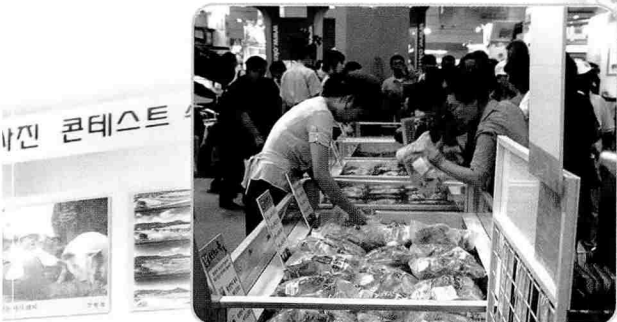
▲ 횡성한우 고기맛은 어떨까