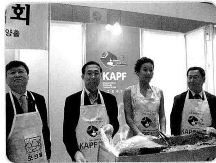
▲ 현영의 통돼지 바비큐 시식 이벤트