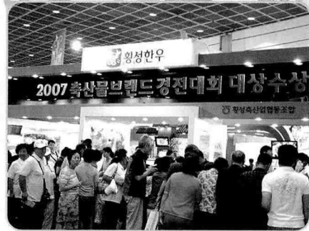
▲ 봄비는 대상 업체 판매장