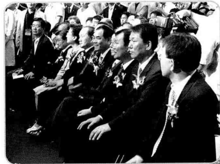
▲ 시상식 참석 내빈