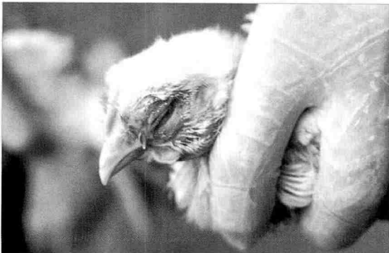
〈사진 2〉 뉴모바이러스의 감염이 의심되는 육계 사진

많은 면역억제성 병원체의 분리, 동정에 대한 어려움 때문에 무시되기 쉽다. 더욱이 대부분의 면역억제성 질병은 현재까지 적당히 이용할 백신이 국내에는 없다. 따라서 이러한 질병들은 양계계군에 널리 퍼져 있다.