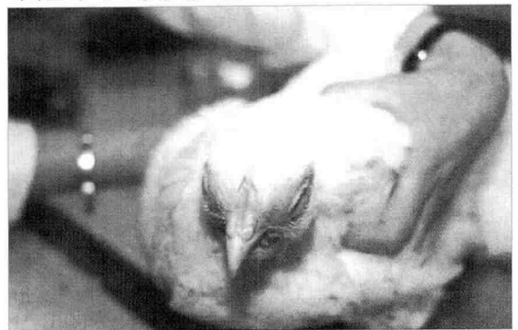
〈사진 1〉 두부종창 증후군