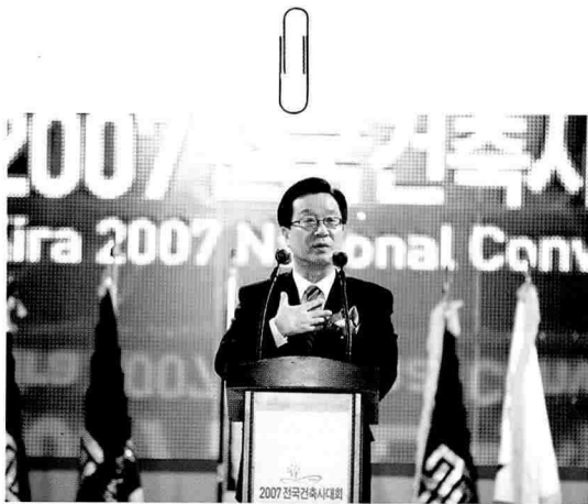
강재섭 한나라당 대표 최고위원의 축사