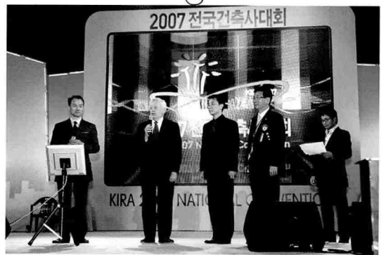
건축사의 밤 행사 중 UIA/PPC공동대표의 축하인사