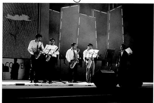
건축사의 밤 행사 중 장기자랑