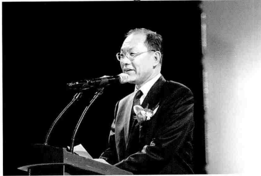
황우여 한나라당 사무총장의 건축문화 발전을 위한 제언