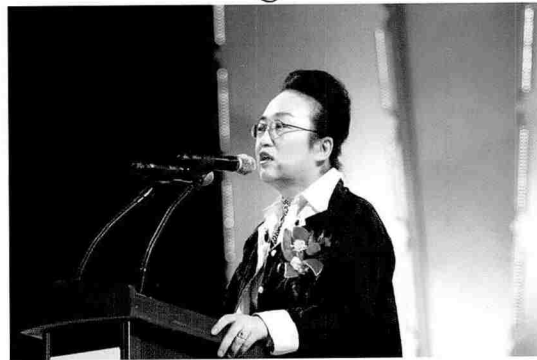
김진애 대통령자문 건설기술·건축문화 선진화위원장의 건축문화 발전을 위한 제언