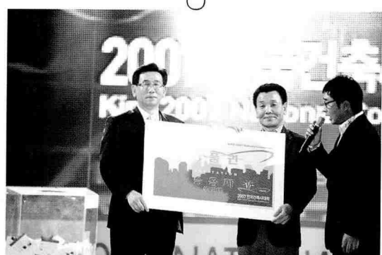
승용차를 경품으로 당첨받은 회원