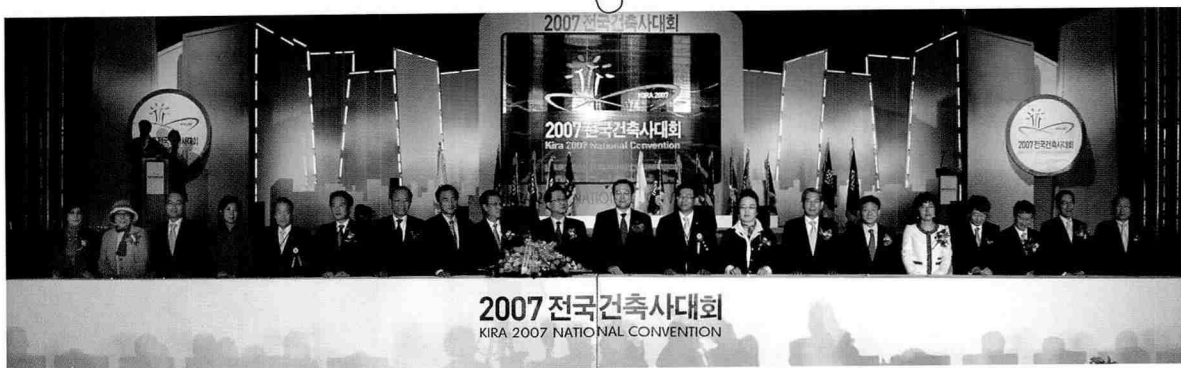
내외 귀빈 기념촬영