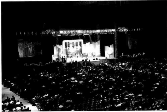
2007전국건축사대회 행사장 전경