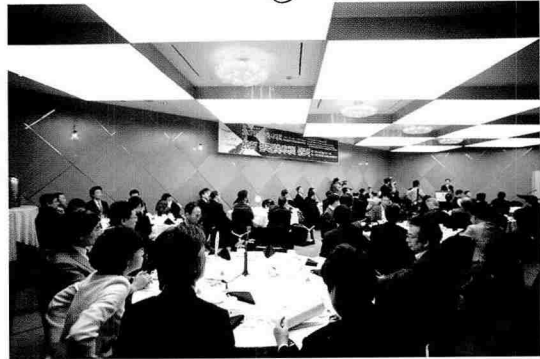
2007전국건축사대회 선포식 전경