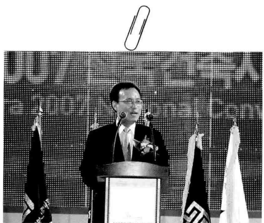
문성현 민주노동당 대표의 축사