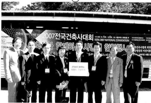
건축사와 함께하는 사랑의 헌혈행사