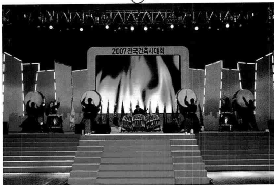
2007전국건축사대회 행사의 시작을 알리는 오프닝 공연