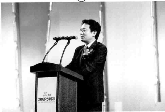
남경필 한나라당 경기도위원장의 건축문화 발전을 위한 제언