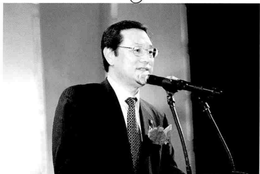
이용섭 건설교통부 장관의 치사