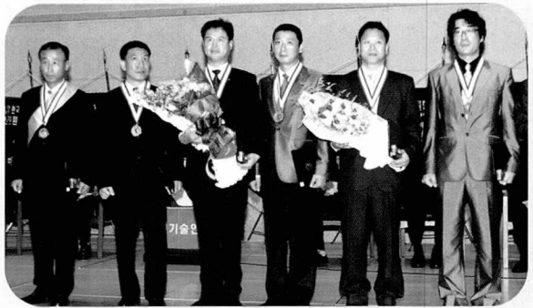
▲ 대한민국환경기술장 수상자들 기념 촬영