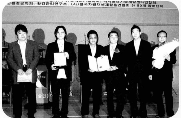
▲ 연합회 명예홍보대사(그룹 사랑과평화) 기념촬영