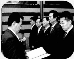
▲ 환경부장관 수여 장면

이날 기념식에서는 제19회 대한민국환경기술장 시상과 환경관련 유공자에 대한 환경부장관상 표창, 한국환경기술인연합회대상 및 명예홍보대사 위촉장·위촉패 수여 등 모두 4개 부문의 시상이 있었다. (☺)