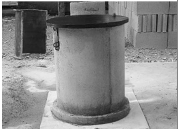
많은 작물보호제제품 보관을 위한 실외 저장소

WHO에서는 작물보호제제품의 의도적인 오용으로 인한 사망 사고를 줄이는 방법으로 시건 장치 보관 프로그램을 추천하고 있으며 2006년 간행물 “Safer Access to Pesticides: Community Interventions”에서도 강력하게 추천하고 있다. 또한 “Pesticides and Health Initiative”에서는 “시건 장치가 있는 보관 장소에 작물보호제제품을 보관함으로써 이를 이용한 충동적인 자살 시도를 줄일 수 있다”라고 밝히고 있다.