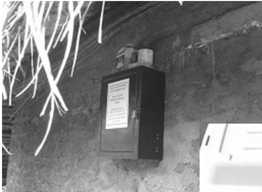
지물씨가 채워져 있는 보관 박스