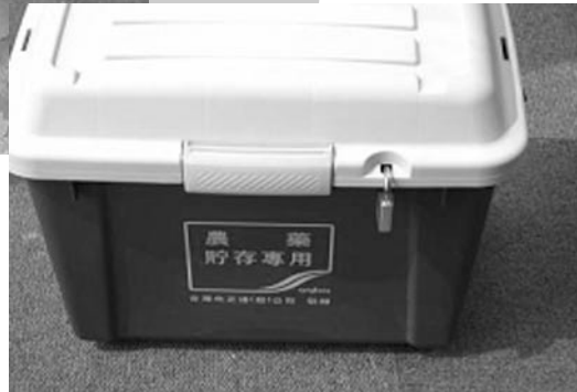
시건장치 달린 운송가능 보관 박스(대만)

며 또한 식량농업기구(FAO)의 “농약의 유통 및 사용에 관한 국제 행동 규약” 5.1/5.3.2항에서도 “정부는 반드시 창고와 농장에서 농약의 안전한 보관을 위한 규정을 마련해야 한다”라고 명시하고 있다. Croplife에서도 작물보호제의 안전하고 효과적인 사용에 관하여 “작물보호제는 반드시 어린이 손에 닿지 않도록 항상 분리되어 있는 독립된 장소에 잠금 장치를 이용하여 보관하여야 한다”와 같은 기준을 제시하고 있다.