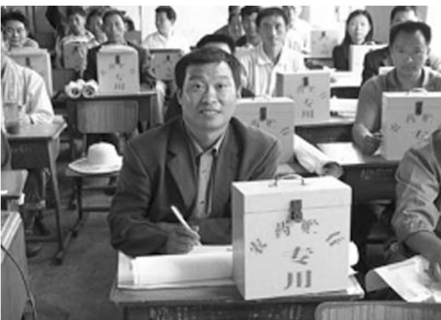
대농민안전사용 교육시 제공한 보관 박스(중국)

이제 모든 작물보호업계는 작물보호제품의 안전하고 효과적인 사용을 위한 안전사용 교육을 지속적으로 강화해야 함은 물론이고 의도적인 오용으로 인한 사고를 최소화 할 수 있는 다양한 방법들을 함께 고민해야 할 것이다. 이와 관련하여 “시건 장치 보관 프로그램”은 작물보호제품을 이용한 의도적 오용 사고를 줄일 수 있는 바람직한 모델이 아닐 수 없으며, 이러한 활동은 모든 작물보호업계가 그 중요성을 같이 인식하고 동참해야 하는 사회적 책무임은 아무리 강조해도 지나치지 않을 것이다. Y