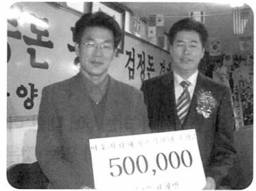
▲ (주)웅지개발(대표 조명호)도 성금 50만 원을 전달했다.