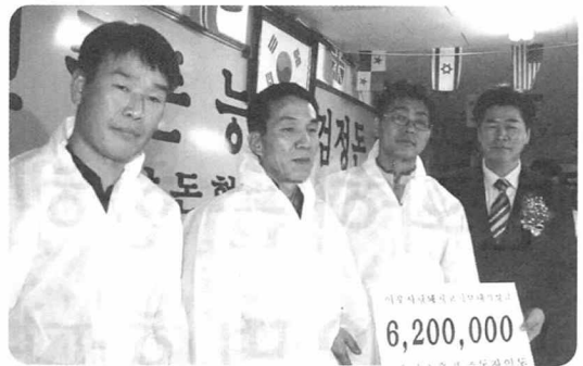
▲ 검정소 출품종돈장에서 공동으로 성금 620만원을 전달했다.