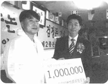
▲ 한국돼지AI협의회는 성금 100만원을 기탁했다.