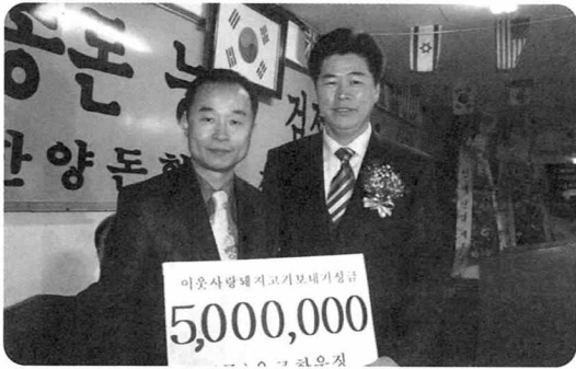
▲ 지난 12일 제2검정소 보은의 날 행사에서 (주)유로하우징은 이웃사랑 돼지고기 보내기 성금 500만원을 전달했다.