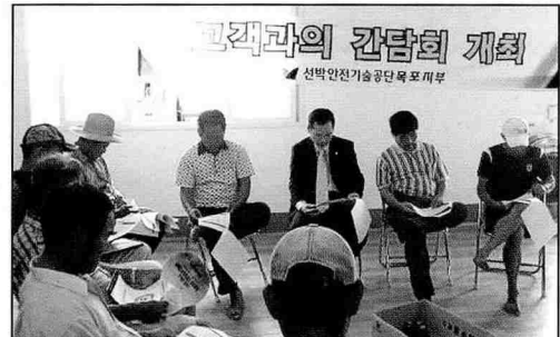
▲ 고객과의 간담회 개최, 초사리 어촌계