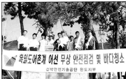
▲ 어선 무상 안전점검 및 바다청소, 흑일도 어촌계

또한 지부는 7월 18일 완도수산고등학교 강당에서 2, 3학년 학생들을 대상으로 특강을 실시하여 우리 공단의 업무와 역할, 구명설비 사용법 및 해양사고 관련내용 등에 대해 자세히 설명함으로써 우리 공단의 이미지제고에 크게 기여하였다.