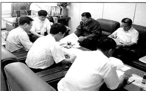
▲ 간담회 개최, 지부사무실