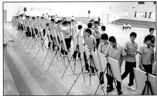
▲ 해양사고 사진전 개최, 과학고 강당

공단 포항지부는 포항해양과학고에서 특강을 실시하고 해양사고 사진전을 개최하였다.