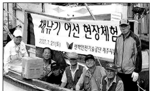
▲ 채낚기 어선 현장체험, 서귀포 앞바다

공단 제주지부는 고객과의 간담회를 개최하고, 채낚기 어선 현장체험을 하였다.