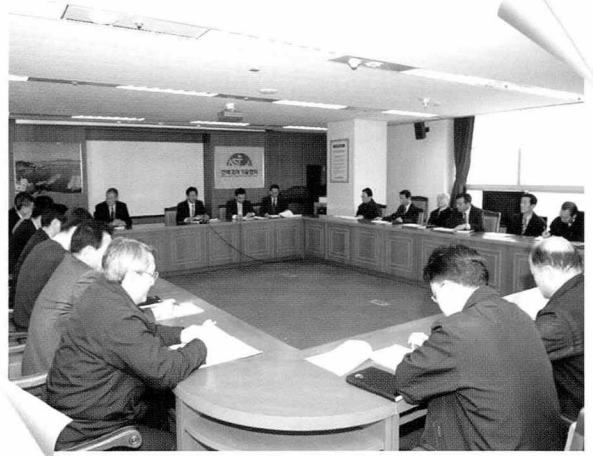
▲ 협회는 지난 1월 3일 공단개설 추진위원회와 실무위원회 회의를 합동으로 가졌다.