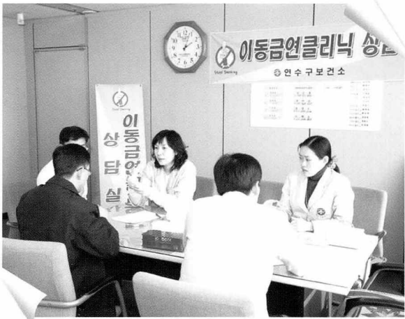
▲ 협회는 1월 15일 연구보건소(인천 연구 소재)의 이동금연클리닉을 실시하였다.