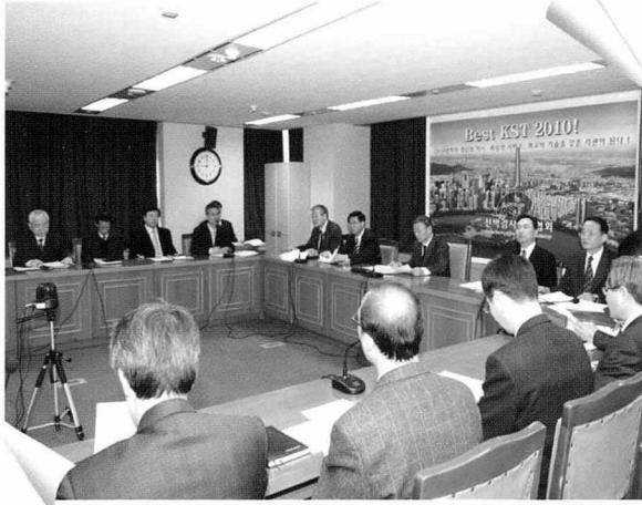
▲ 협회는 지난 1월 8일 대회의실에서 경영전략포럼을 개최하였다.