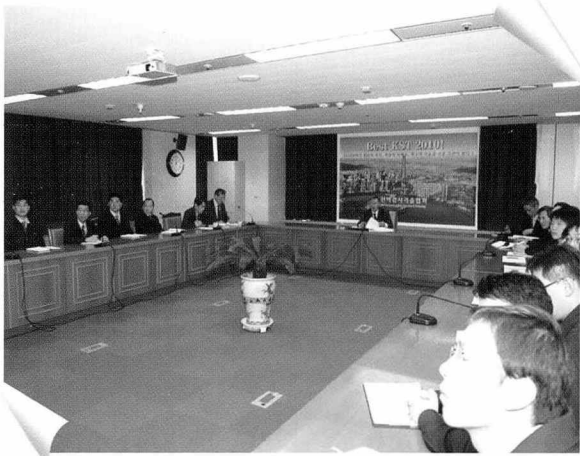
▲ 협회는 1월 8일부터 16일까지 대회의실에서 2007년도 팀별 업무보고를 실시하였다.