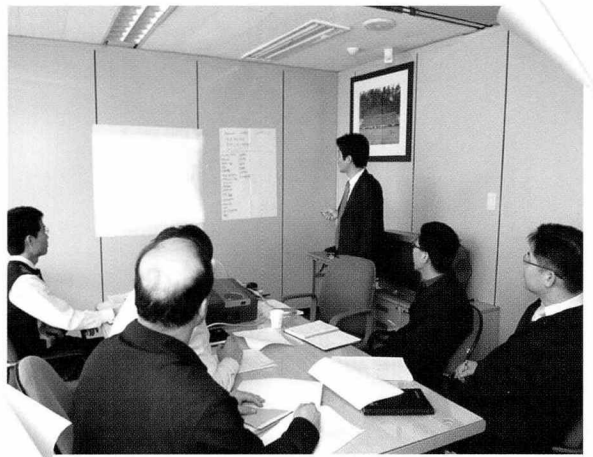
▲ 협회는 1월 25일 평생학습체계구축을 위한 디자인팀 회의를 실시하였다.