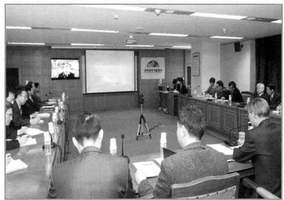
- 전국지부장회의 개최 -