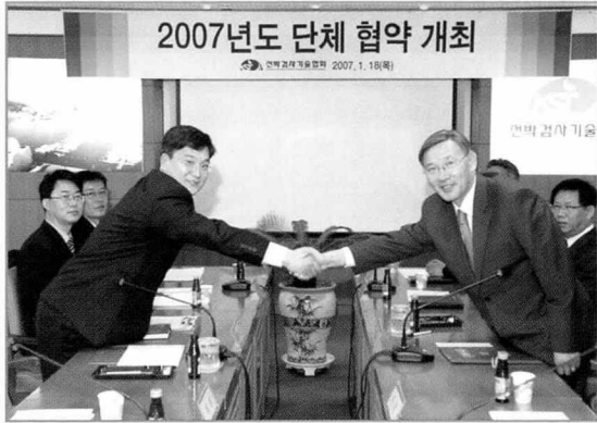
- 2007년도 단체 협약 개최 -

선박검사기술협회(이사장 김성규)와 선박검사기술협회 노동조합(위원장 한두희)은 지난 1월 18일 본부대회의실에서 2007년도 단체협약을 체결하였다.