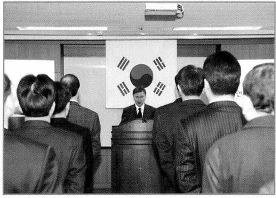
- 2007년 시무식 장면 -