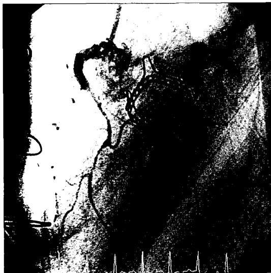
Fig. 2. Diffuse stenotic lesion on the right coronary artery.

중환자실 도착 5시간 후에 인공호흡기를 이탈하였다. 술 후 10일째 시행한 심장 초음파상 좌심실 구출률 50%인 경증의 심벽운동 저하 외 특이소견 없었으며 술 후 11일째 별다른 합병증 없이 퇴원하였다.