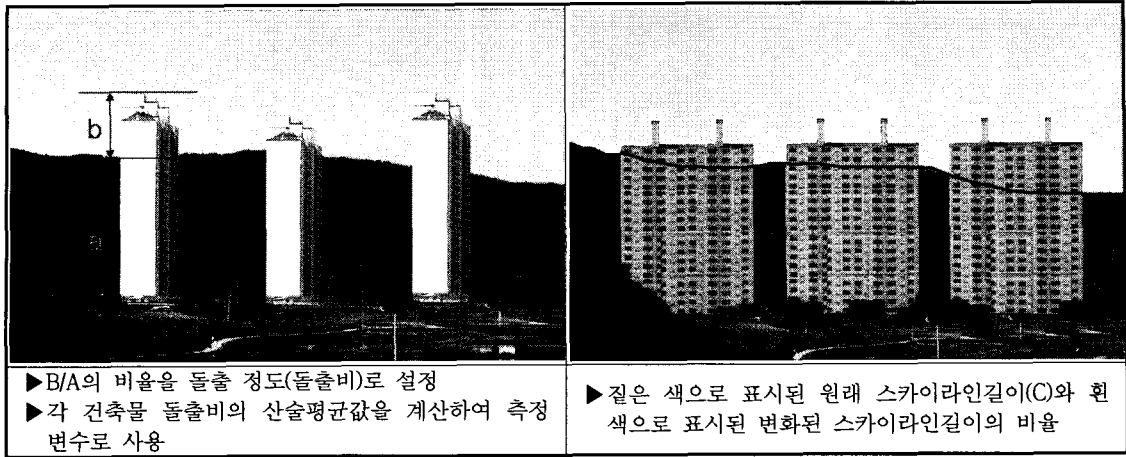
그림 2. 측정변수의 예시와 설명