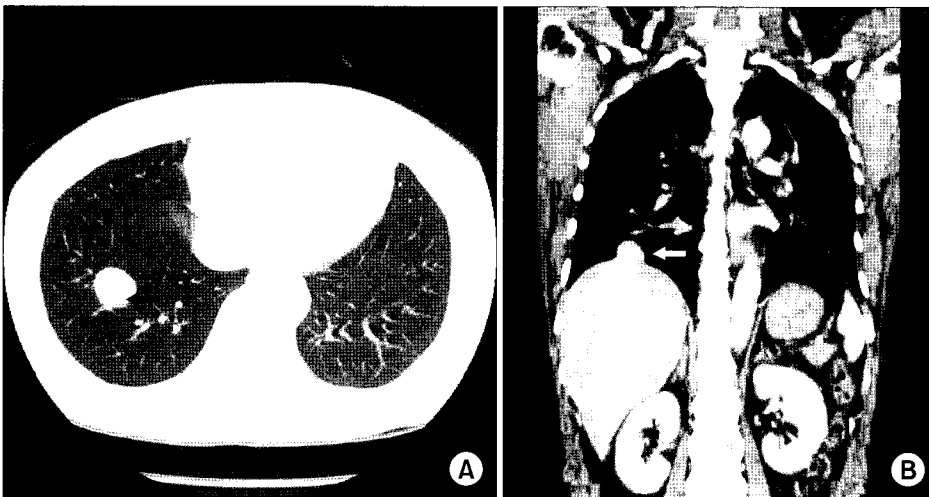
Fig. 2. (A) Axial chest CT scan shows a well defined mass in right lower lobe (arrow), suggesting benign lung tumor. (B) Coronal reformation chest CT scan reveals right lower lung mass (arrow), but it cannot be differentiated with a diaphragmatic mass.

수술은 우측 후측방 개흉술을 시행하였다. 수술 소견상, 흉막유착이나 흉막삼출액은 없었으며, 폐도 정상으로 보였다. 우측 횡격막의 중심 부위에 3.5×3.5 cm와 2.0×2.0 cm 정도의 둥글고 매끈한 간 조직처럼 보이는 2개의 종양이 있었으며, 이 종양들은 횡격막에 부착되어 있었다(Fig. 3). 정상적인 간과 연결되는 혈관 등을 포함한 경구조물(pedicle)은 없었고, 횡격막 탈장이나 누공도 보이지 않았다. 횡격막의 일부를 포함한 종양의 절제를 시행하고 횡격막은 단순봉합하였다. 병리학적 검사에서 흉강내 이소성 간으로 확진되었다. 환자는 특별한 문제 없이