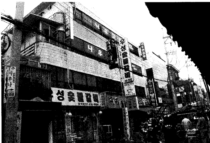
〈사진 2-1 화재현장 전경〉