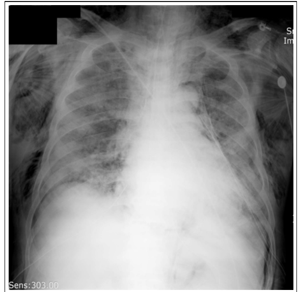
Figure 3. Chest radiography after tube