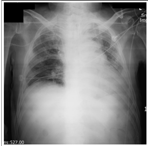
Figure 4. Follow up film at 10 days thoracostomy. after tracheostomy shows resolving subcutaneous emphysema.

의 긴장성 기흉과 피하조직기종 소견을 관찰하여 양측 흉곽에 흉관 삽입술을 시행하였고(Figure 3), 환자의 혈압과 맥박은 정상적으로 회복되었다. 환자는 4일 뒤 삽입한 흉관을 제거하였고, 피하조직기종도 7일 뒤 회복되었다(Figure 4).