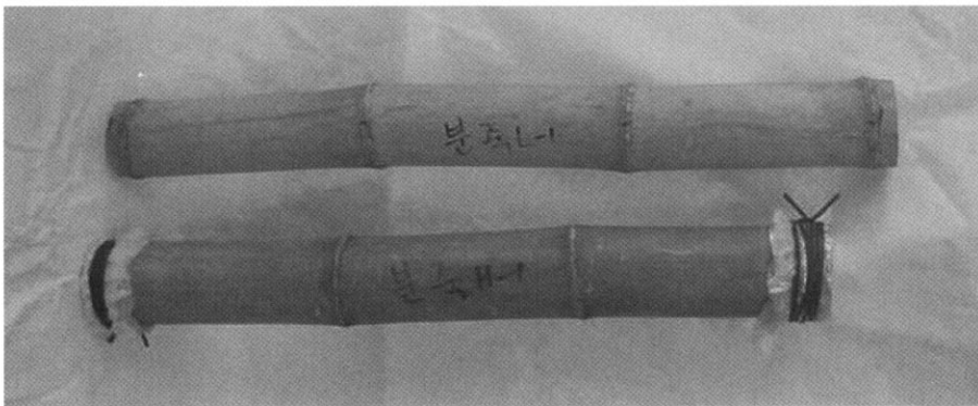
Fig. 1. Control bamboo tube (above) and Vapor-dam treated bamboo tube (below).