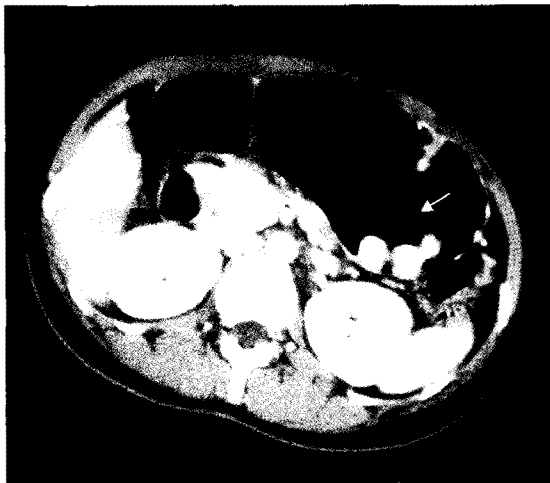
Fig. 2. Abdominal CT scan shows multiple enhancing polypoid lesions in the stomach with no evidence of distant metastasis or peritoneal seeding.