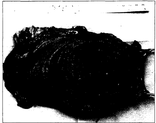
Fig. 3. Specimen finding shows multiple protruding polyps up to 5 cm-sized from mid-body to cardia in the stomach.