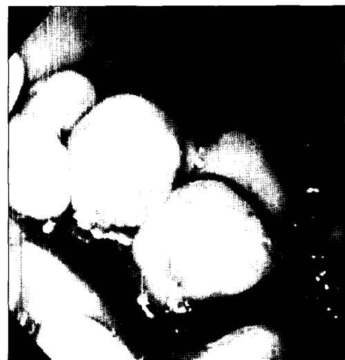
Fig. 1. Endoscopic finding shows multiple polypoid lesions from mid-body to cardia in the stomach.

위에 발생하는 유암종(carcinoid tumor)은 위저부에 있는 장크롬친화유사세포[enterochromaffine-like (ECL) cell]의 증식에 의해 발생하는 종양이다. 위유암종은 전체 유암종의 1% 이하이며 모든 위 신생물의 2% 이내로 드문 질환이다.(1) 그러나 최근 미국의 조사에 따르면 소화기관에 발생